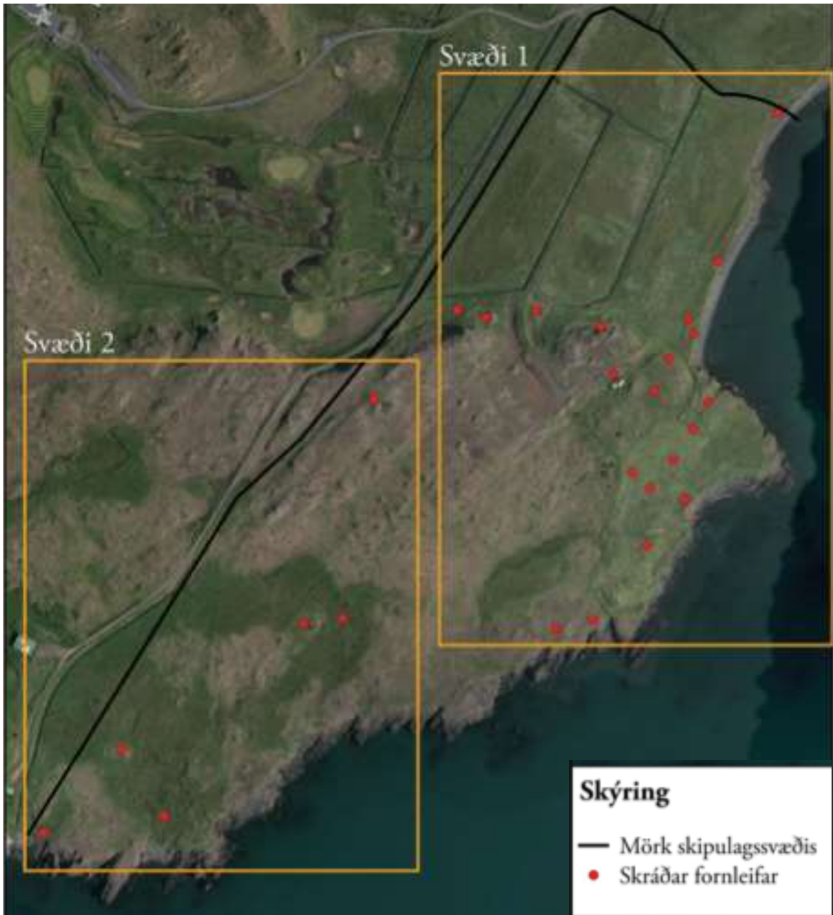
MYND 4. Myndin sýnir staðsetningu þekktra fornleifa í Presthúsum, merktar með rauðum hringjum. Svört lína sýnir jarðamörk.

Nokkrar fornleifar eru á jörðinni Presthús skv. skráningu fornleifa sem unnin var 2019 af Fornleifastofnun Íslands; Prestvík á Kjalarnesi, Deiliskráning vegna hugmynda um uppbyggingu . Búsetuminjar eru að miklu leyti innan 50 metra friðlínu við ströndina ásamt því að vera í nálægð við gamla bæjarstæðið. Framkvæmdir miðast við að hrófla sem minnst við minjum á svæðinu.