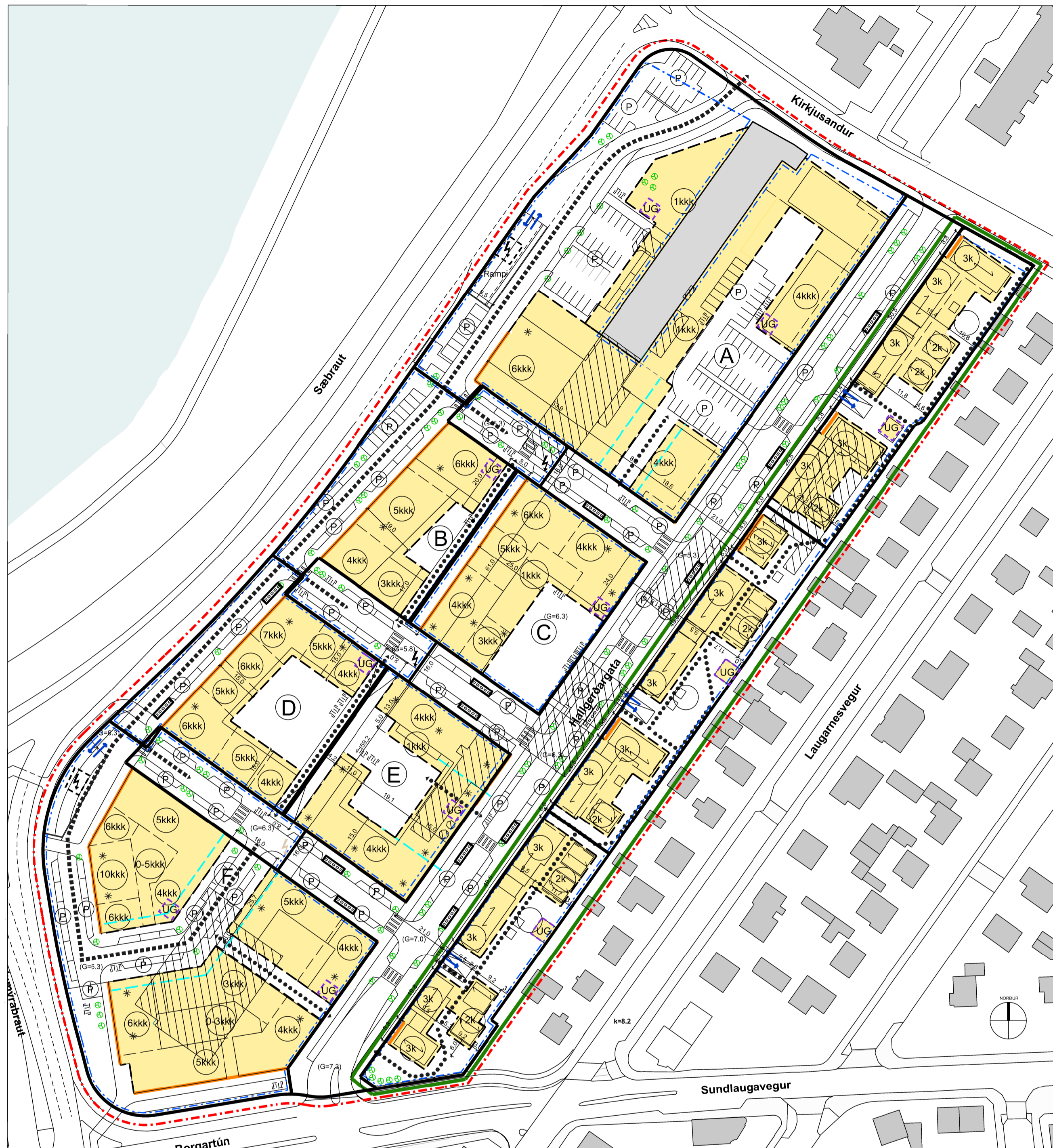
Gildandi deiliskiplug samþykkt í B-deild stjórnartíðinda 16.11.2016