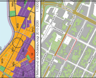
Staðsetning reits 1.174.0 1:3000