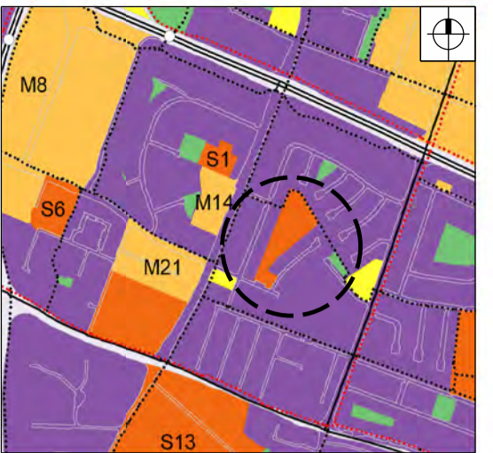
HLUTI AF AÐALSKIPULAGI REYKJAVÍKUR 2010-30.

Að öðru leyti standa áður samþykktir skilmálar deiliskipulags Hvassaleitisskóla óbreyttar.