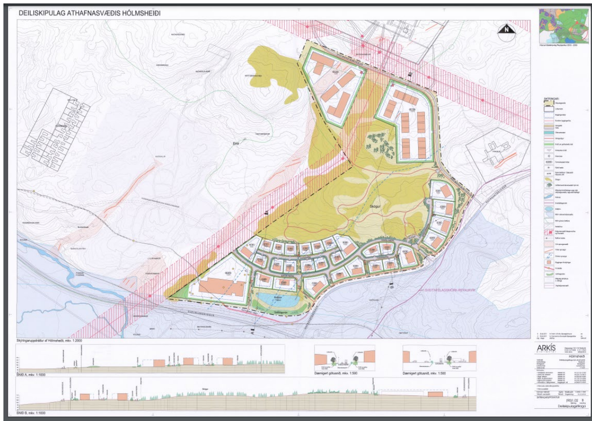
Mynd 2. Deiliskipulag 1. áfanga athafnasvæðis

Ekki er í gildi deiliskipulag fyrir svæðið en eins og fyrr greinir er í gildi er deiliskipulag fyrir 1. hluta athafnafnasvæðisins.