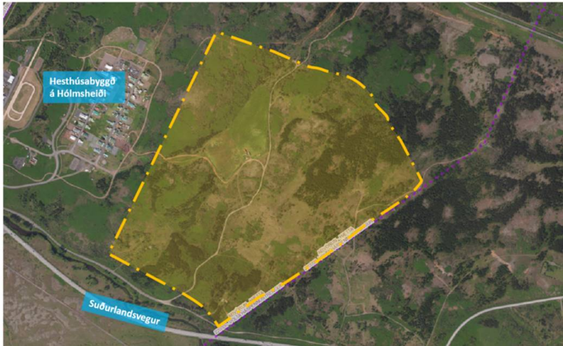
Mynd 1. Afmörkun skipulagssvæðis.