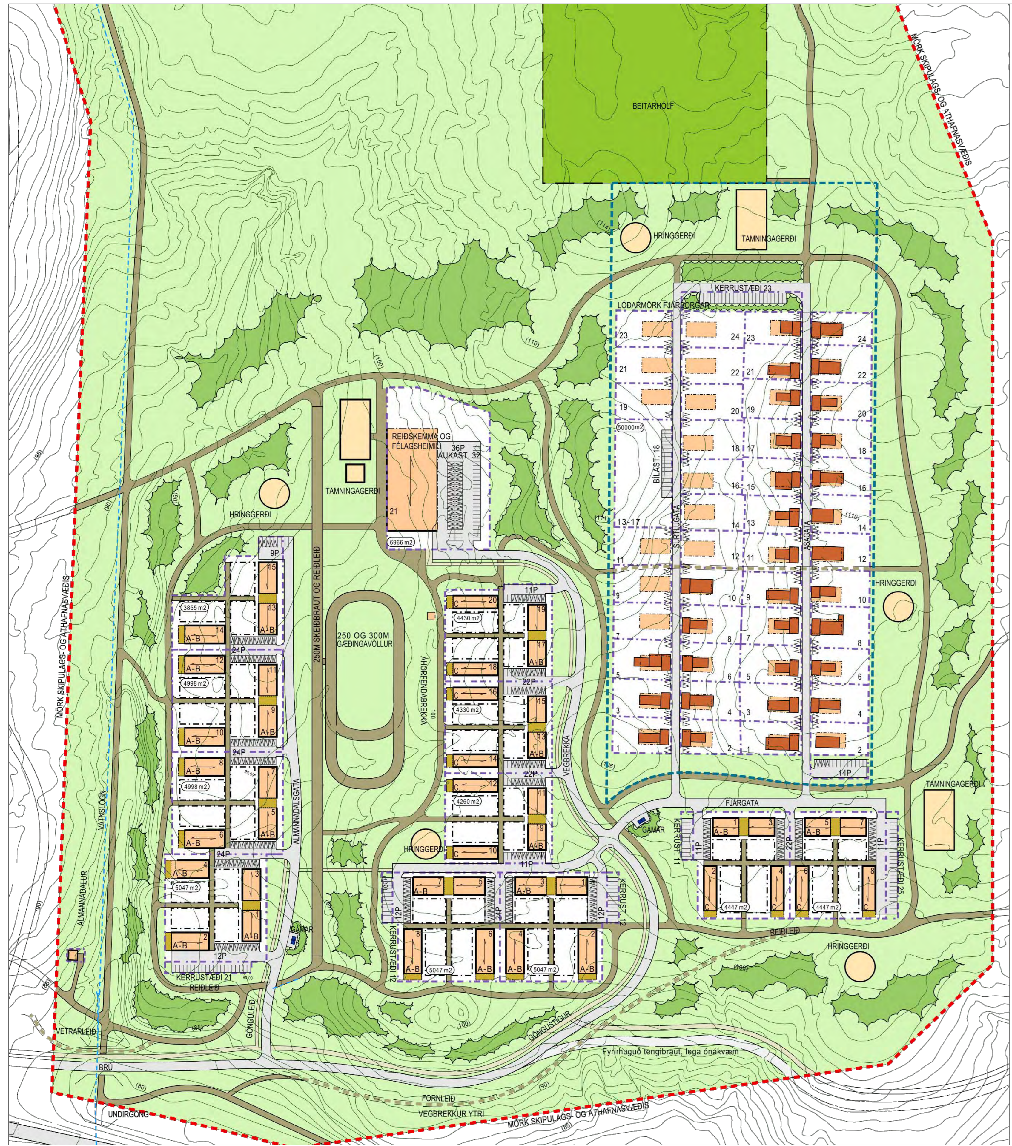
Gildandi deiliskipulag Hesthúsabyggðar á Hólmsheiði var samþykkt í Borgarráði 23. september 2003. Síðasta breyting á deiliskipulaginu var samþykkt 1. ágúst 2013. Mkv:1:1500