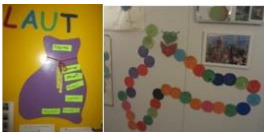
Samvinnuverkefni með heimilum

Mikil áhersla var lögð á að festa agastefnuna okkar í sessi og henni til stuðnings fór leikskólastjóri ásamt sérkennslustóra á PMTO námskeið. Fræðsla var um aga á starfsdögum í vetur. Starfsfólk fór líka á námskeið með Vöndu Sig. varðandi einelti og er að nýta sér það markvisst. Við brydduðum upp á ýmsu til að vekja okkur