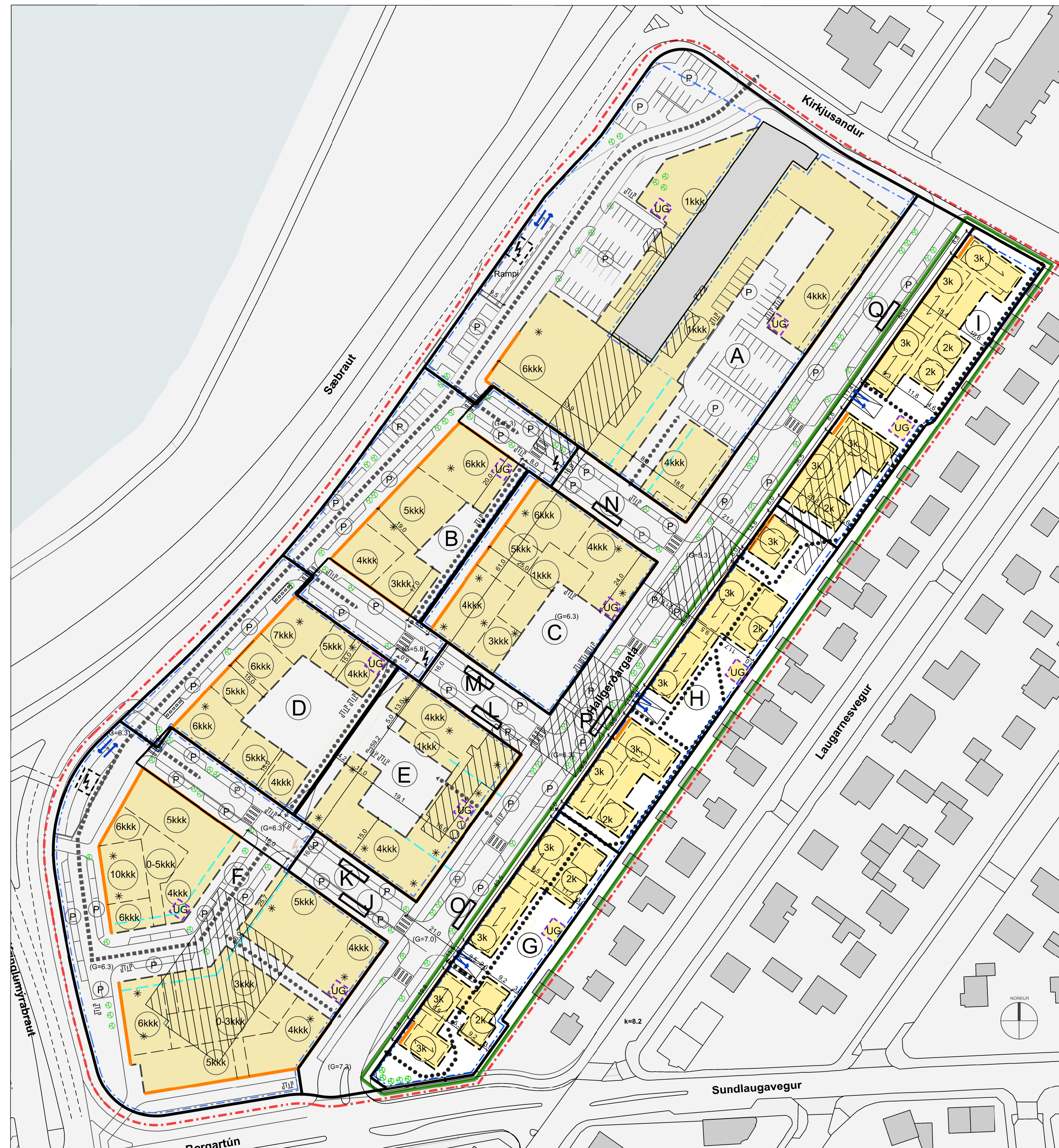
Tillaga að breyttu deiliskipulagi Mkv. 1:1000