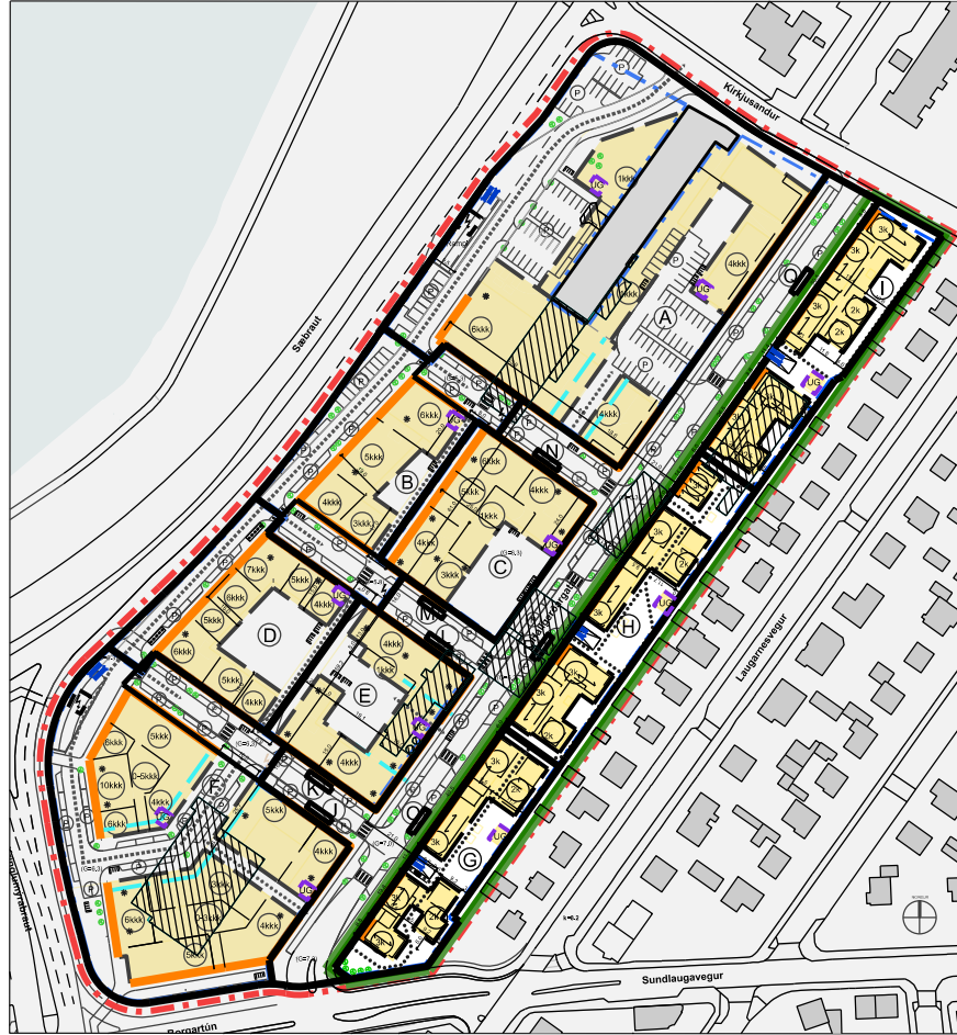
Tilaga að breyttu deiliskipulagi Mív, 1:1000