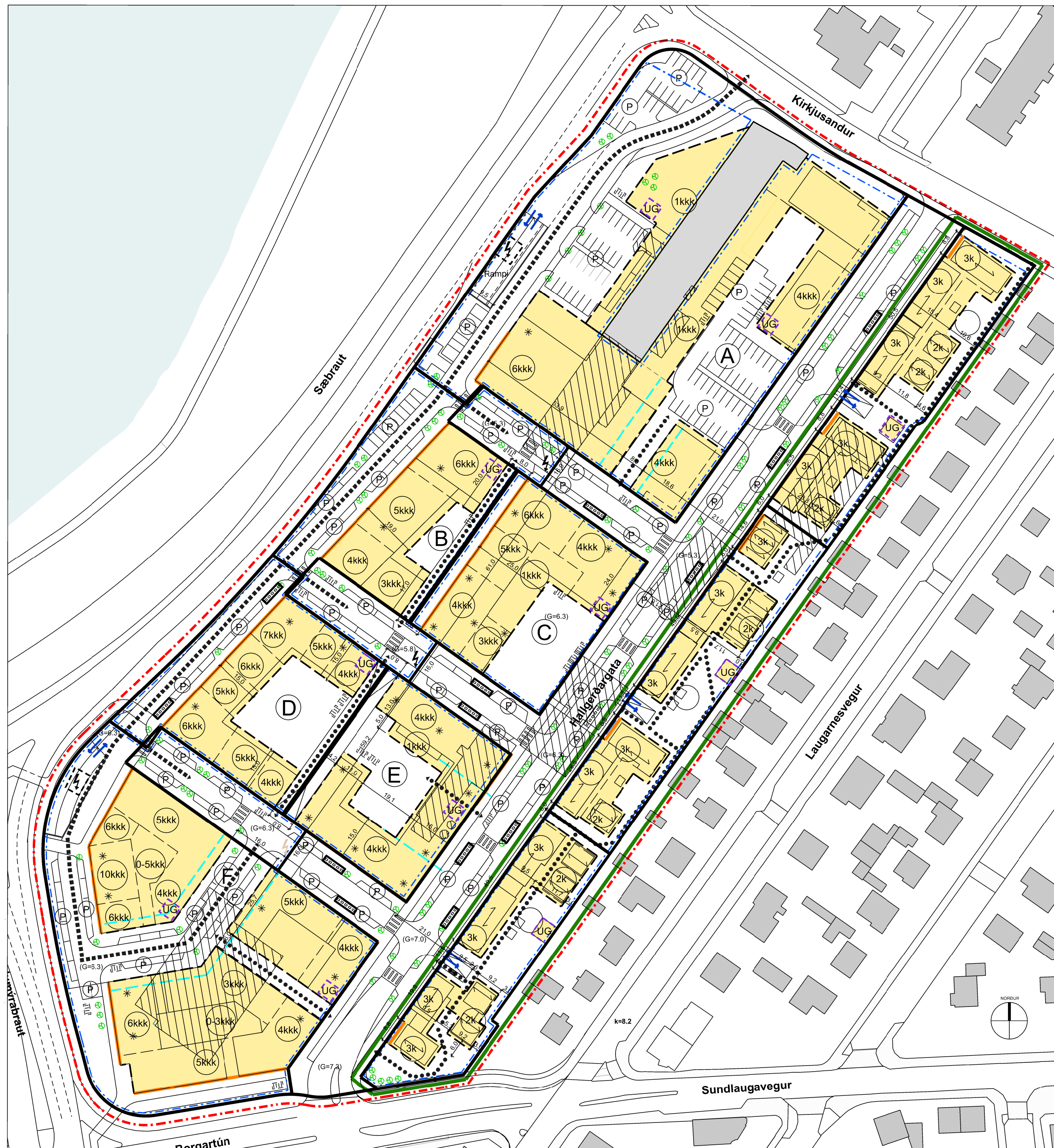
Gildandi deiliskipulagi samþykkt í B-deild stjórnartíðinda 16.11.2016