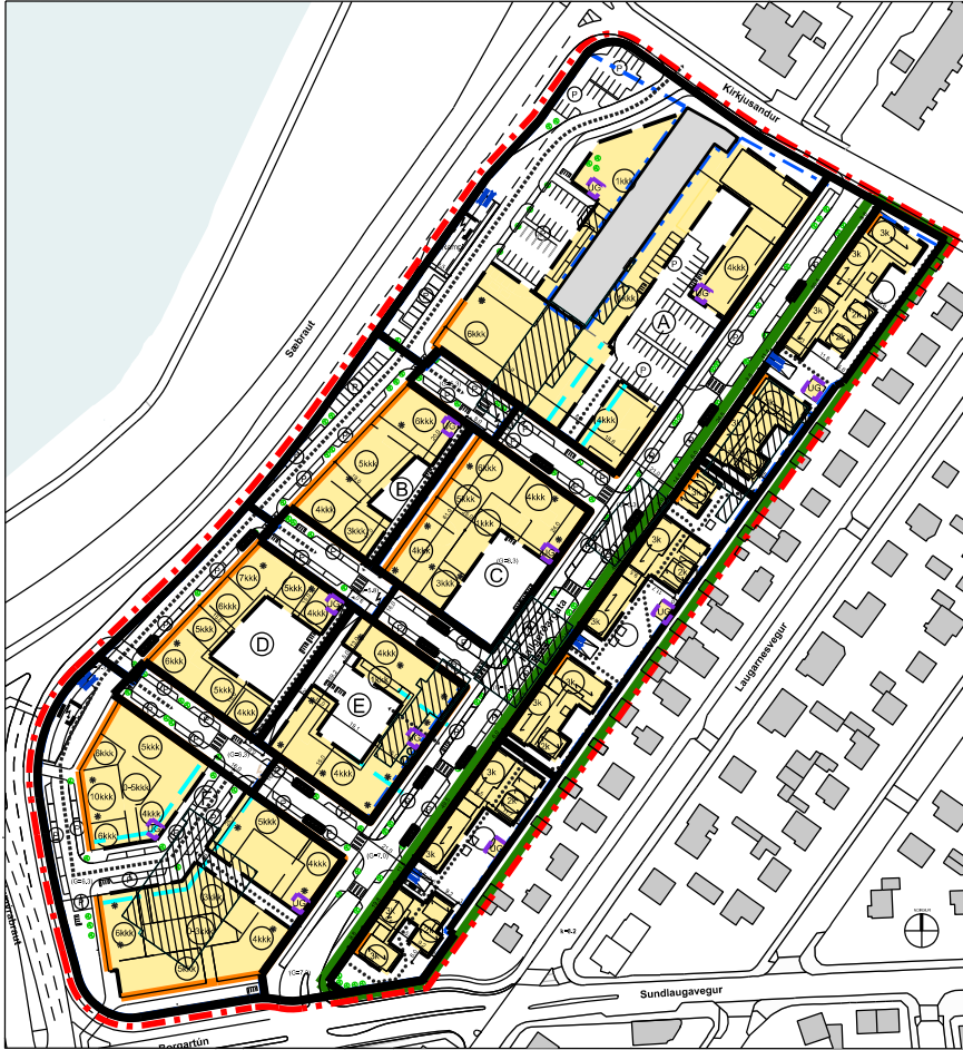
Gildandi deiliskipulagi samþykkt í B-deild stjórnartíðinda 16.11.2016