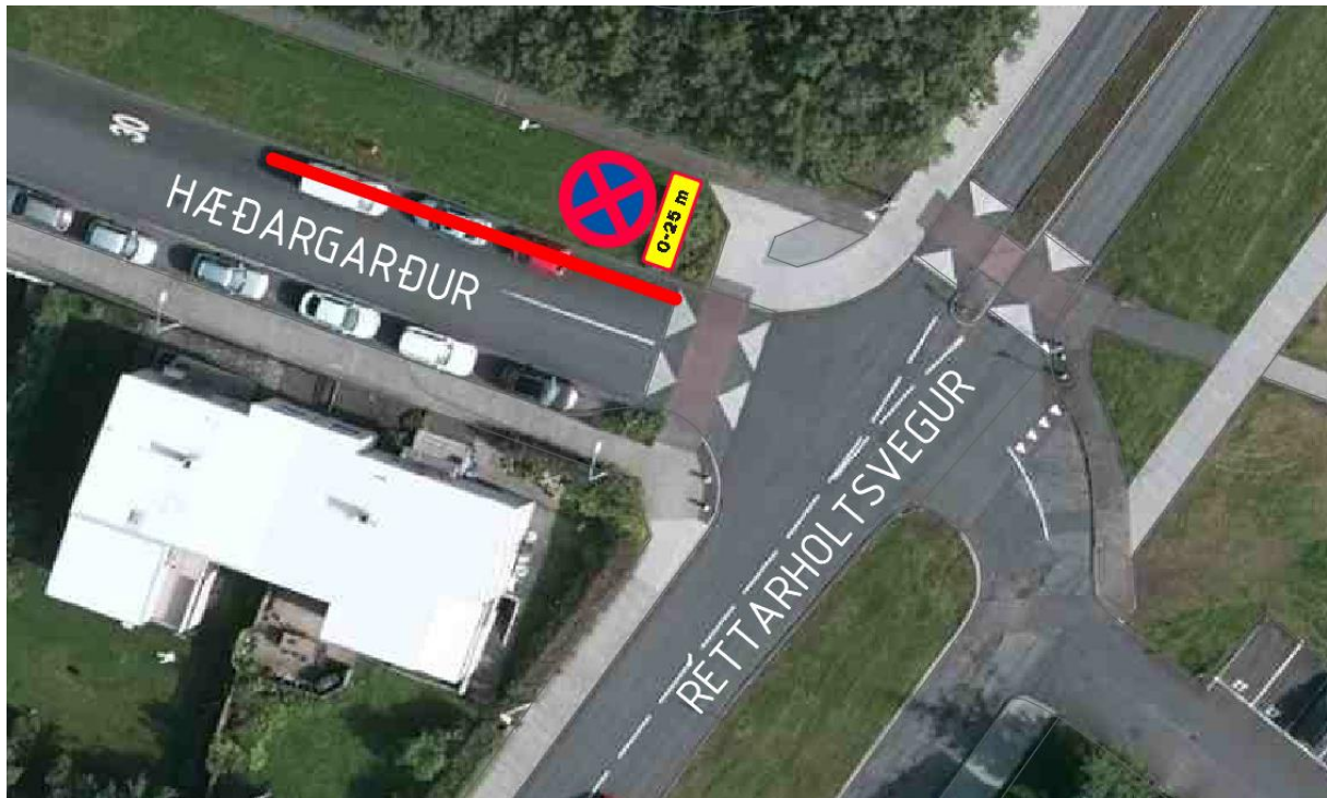
Mynd 1 Lagt er til bann við því að leggja og stöðva í norðurkanti Hæðargarðs næst Réttarholtsvegar, bannið gildi 25 metra inn götuna, merkt með rauðu.