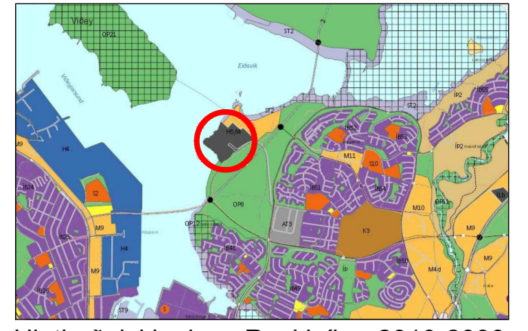
Hluti aðalskipulags Reykjavíkur 2010-2030