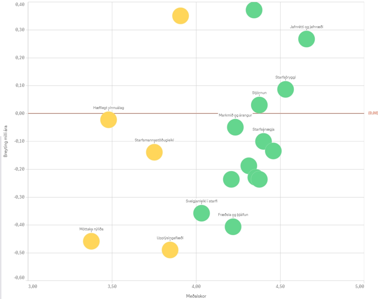
Meðalskor þátta og breyting á milli ára 2020 og 2021