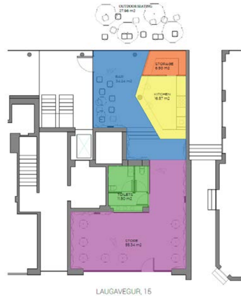
Skissa af fyrirhugaðri uppskiptingu rýmisins.