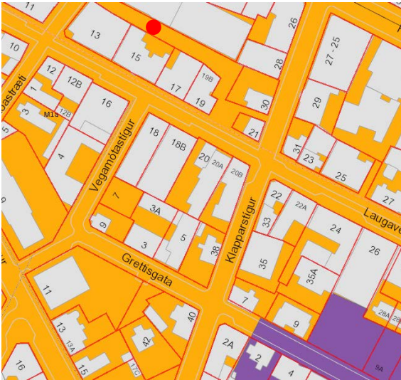
Kort af Borgarvefsjá

Lögð fram fyrirspurn Stórval ehf. varðandi veitingarekstur að Laugavegi 20b, jarðhæð.