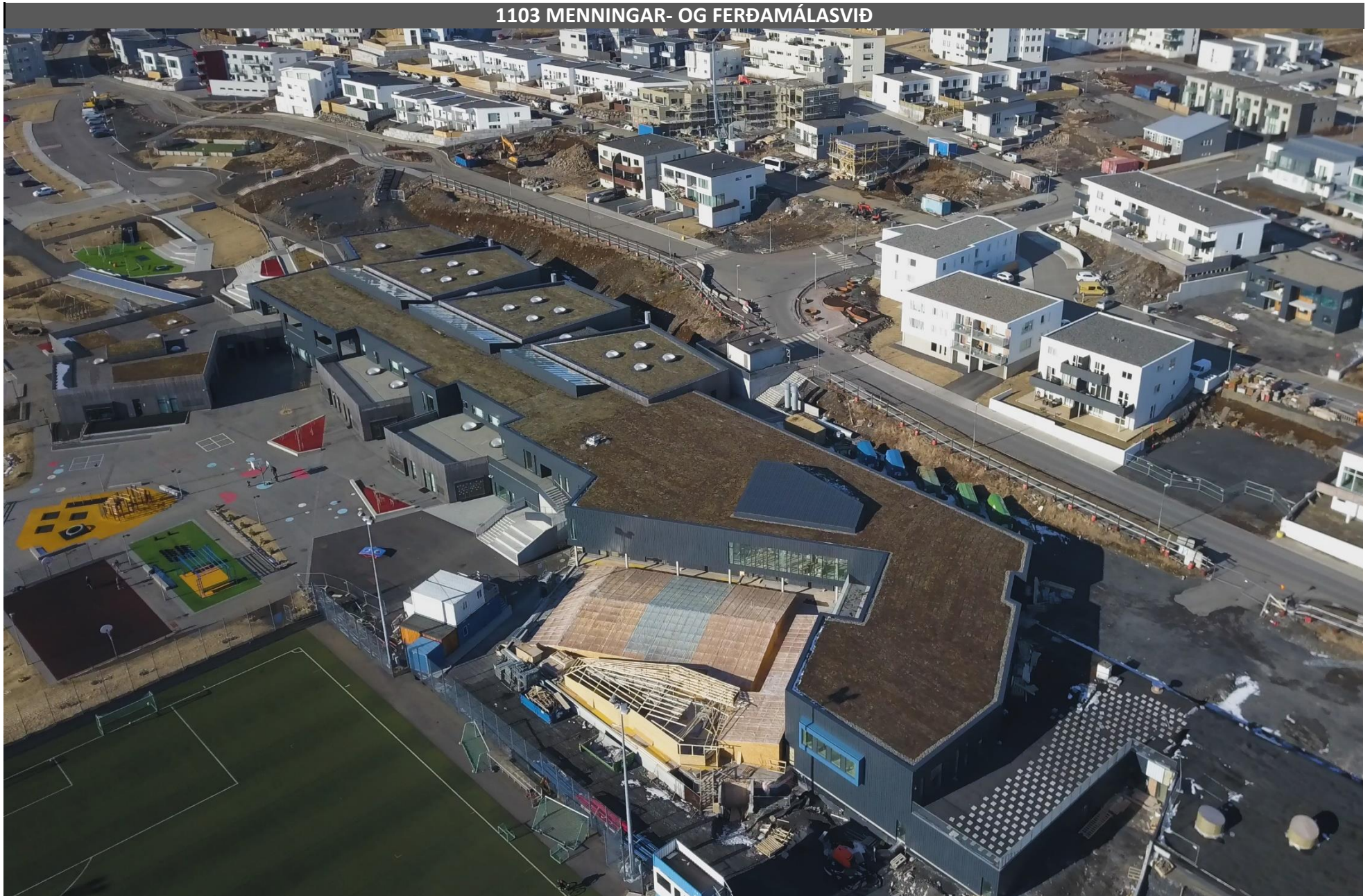
SKÓLI, MENNINGARMÍÐSTÖÐ OG SUNDLAUG Í ÚLFARSÁRDAL