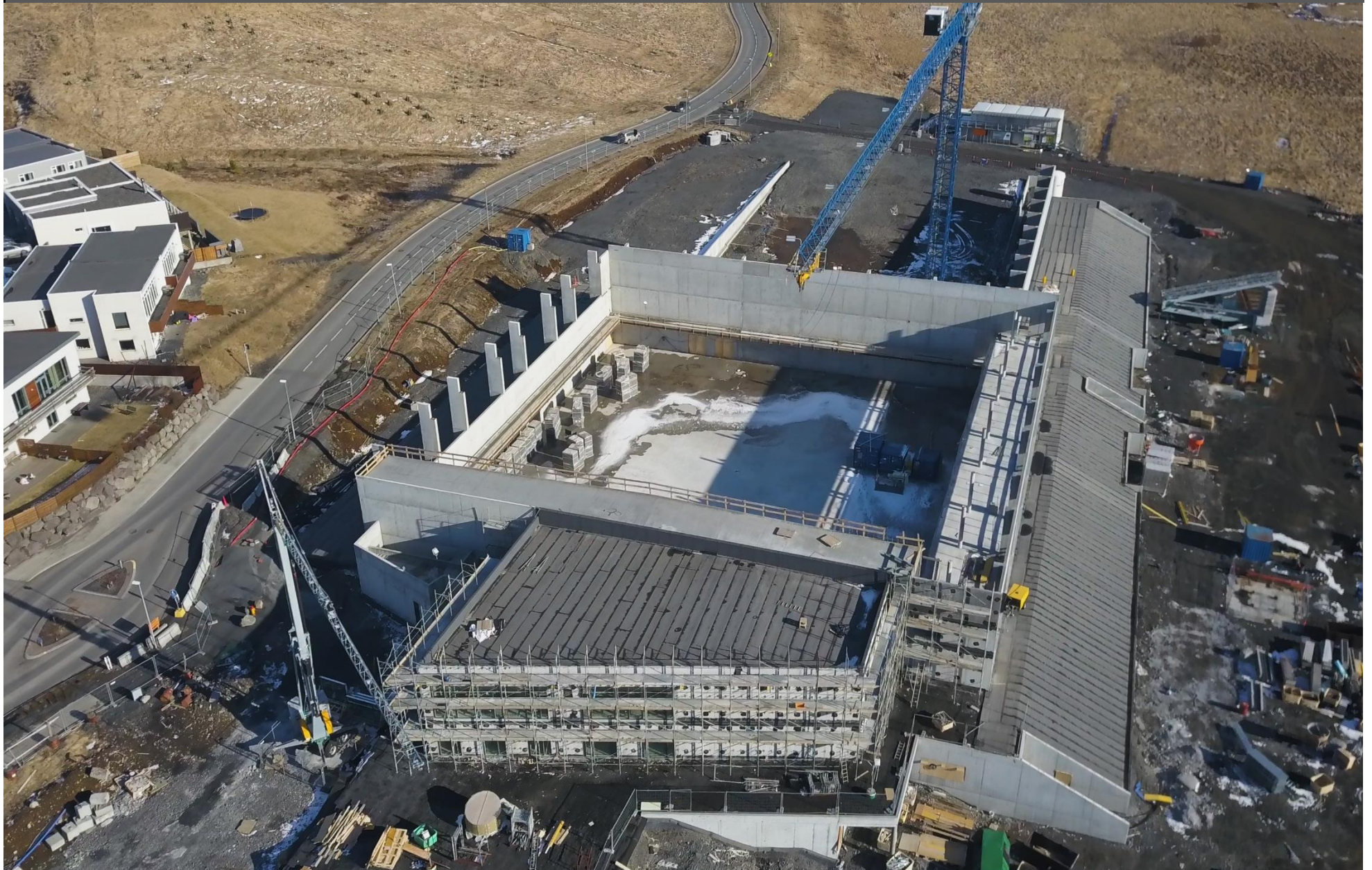
ÍPRÓTTAHÚS FRAM Í ÚLFARSÁRDAL