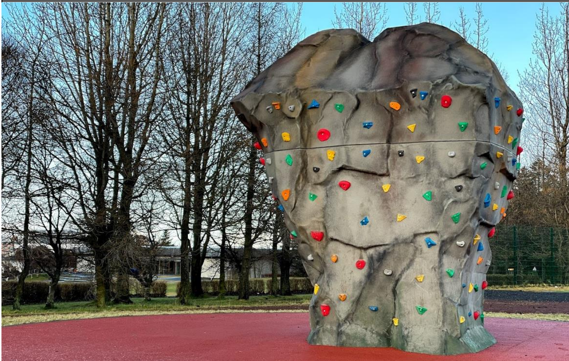
KLIFURKLETTUR Á KLAMBRATÚNI HVERFIÐ MITT