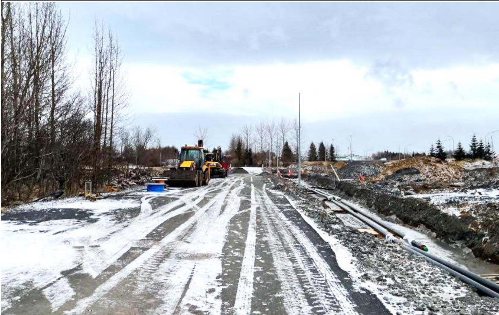
VINNA VIÐ GERÐ GÖNGU- OG HJÓLASTÍGS FRÁ BÚSTAÐAVEGI