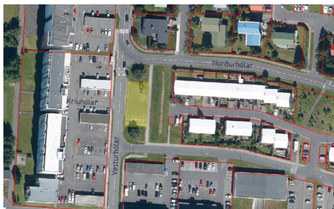
Mynd 2 Bílastæði við Vesturhóla sem lagt er til að verði merkt eingöngu fyrir fólksbifreiðar er merkt með gulu.

Vesturhólar: Bílaplanið við Vesturhóla, móts við Kríuhóla, var upprunalega útbúið undir stærri atvinnubifreiðar. Stæðinu var lokað fyrir nokkrum árum sökum hávaða- og loftmengunar sem íbúar höfðu reglulega kvartað yfir. Samkvæmt tillögu að hverfisskipulagi Breiðholts er gert ráð fyrir uppbyggingu á reitnum en hleðslustöðvum fyrir rafmagnsbíla á jaðrinum. Tillagan fellst í að þar til verður að uppbyggingu verði nota núverandi svæði bílastæði fyrir fólksbíla (bæði hefðbundna og til hleðslu).