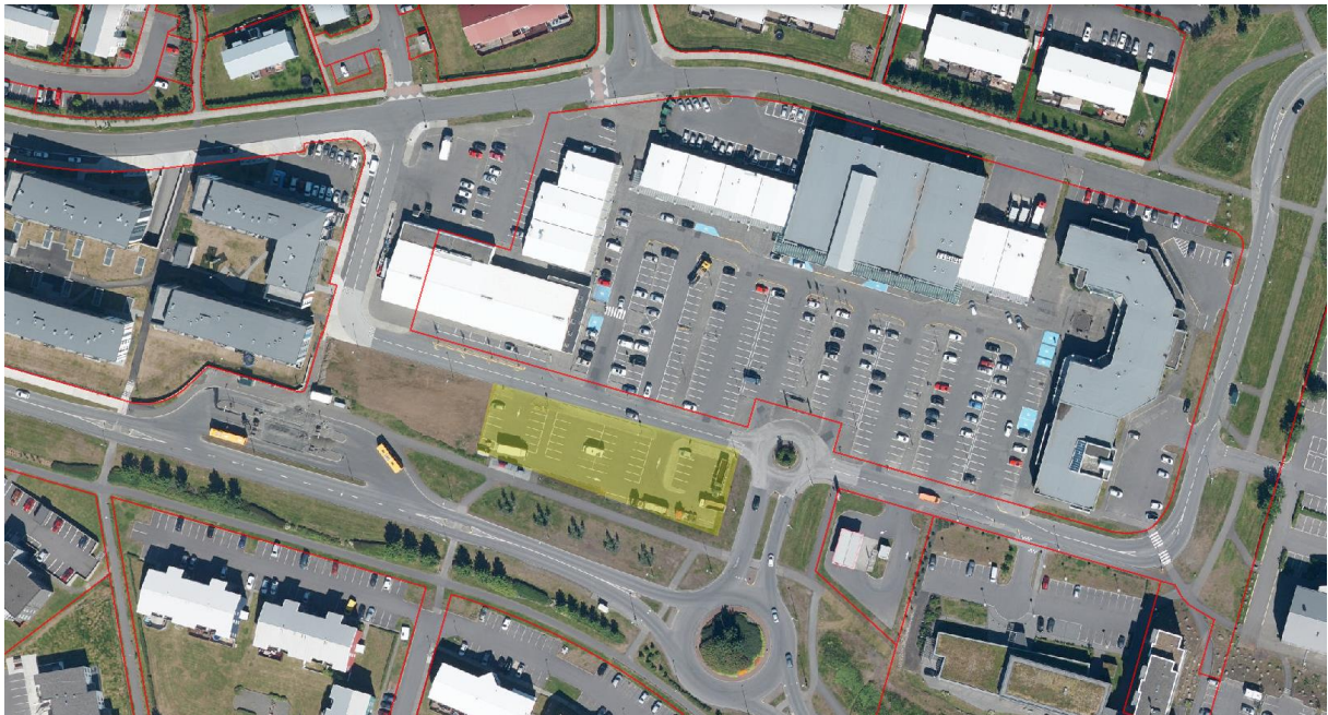
Mynd 3 Bílastæði við Spöng sem lagt er til að verði merkt eingöngu fyrir fólksbifreiðar er merkt með gulu.

Spöngin: Síðusta árið hefur færst í aukana að stærri ökutækjum sé lagt á bílplani í borgarlandi, sunnan götunnar Spangar og austan strætóstöðvarinnar í Spöng. Yfir planið liggur gönguleið frá Borgavegi að verslunarkjarna og miðar hönnun og frágangur svæðisins við stærð fólksbifreiða.