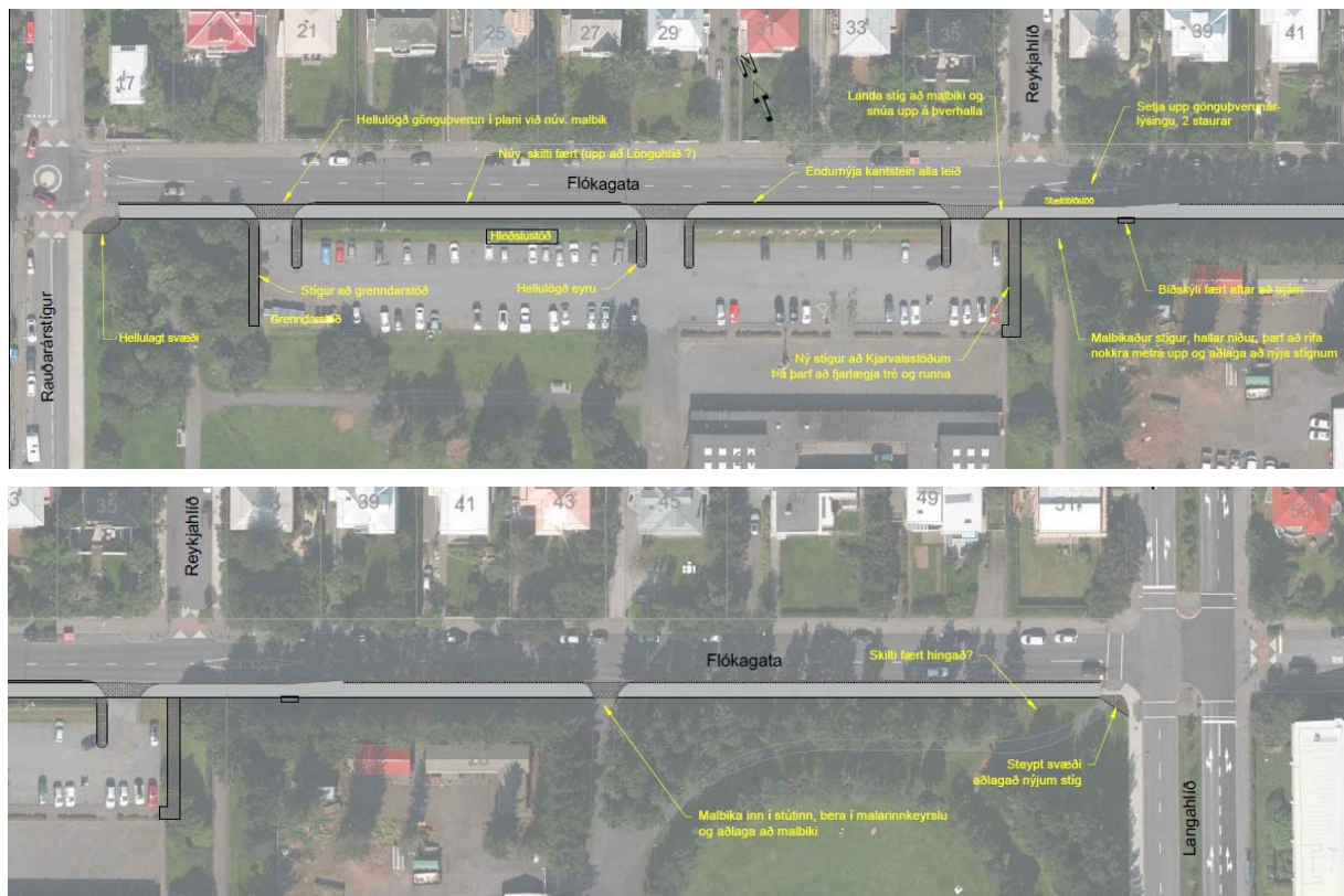
Mynd 2 Frumdrög hönnunar að stíg meðfram Flólagötu milli Rauðarstígs og Lönguhlíðar.