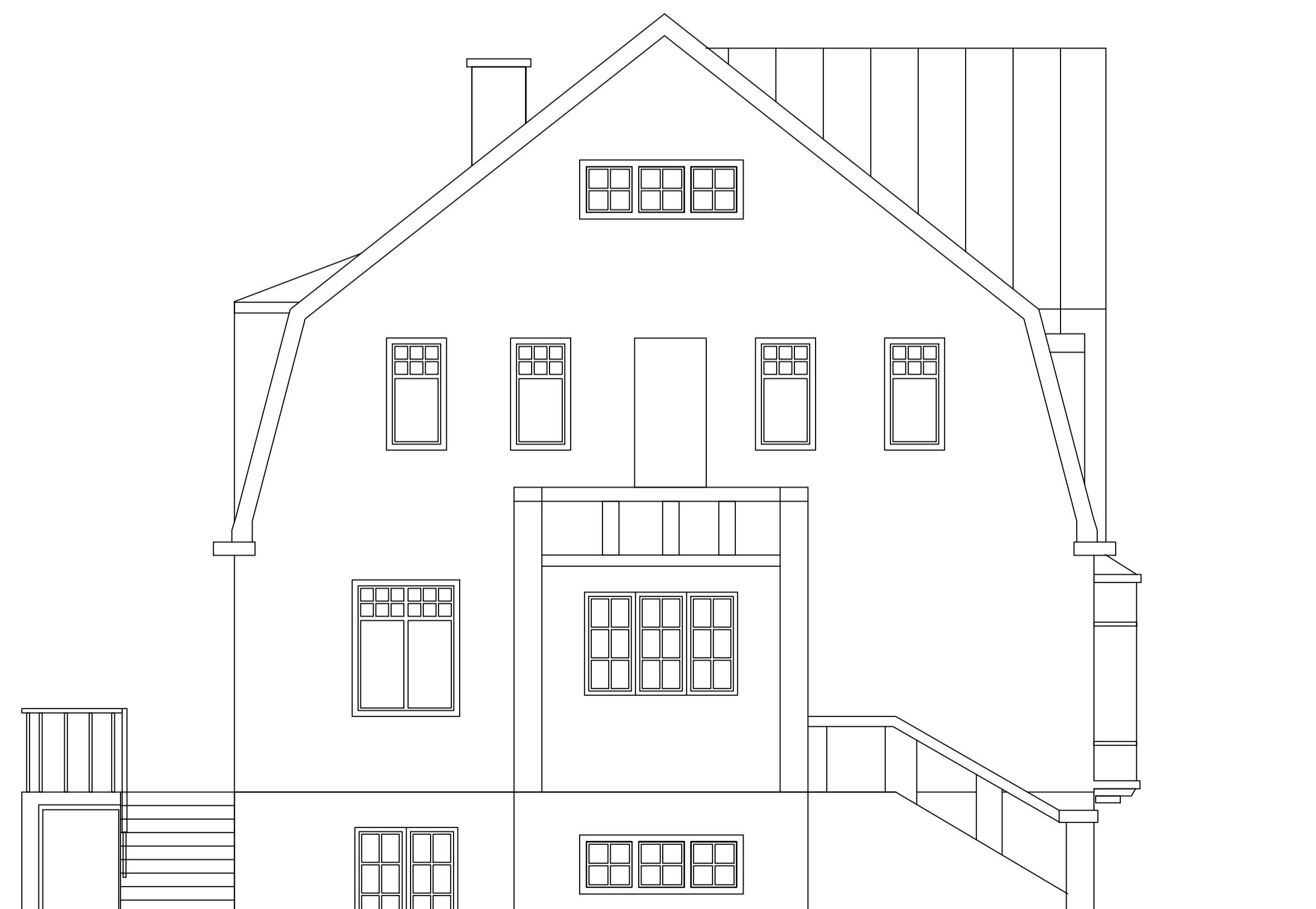
NORÐ-VESTUR HLIÐ FYRIR BREYTINGAR 1:50