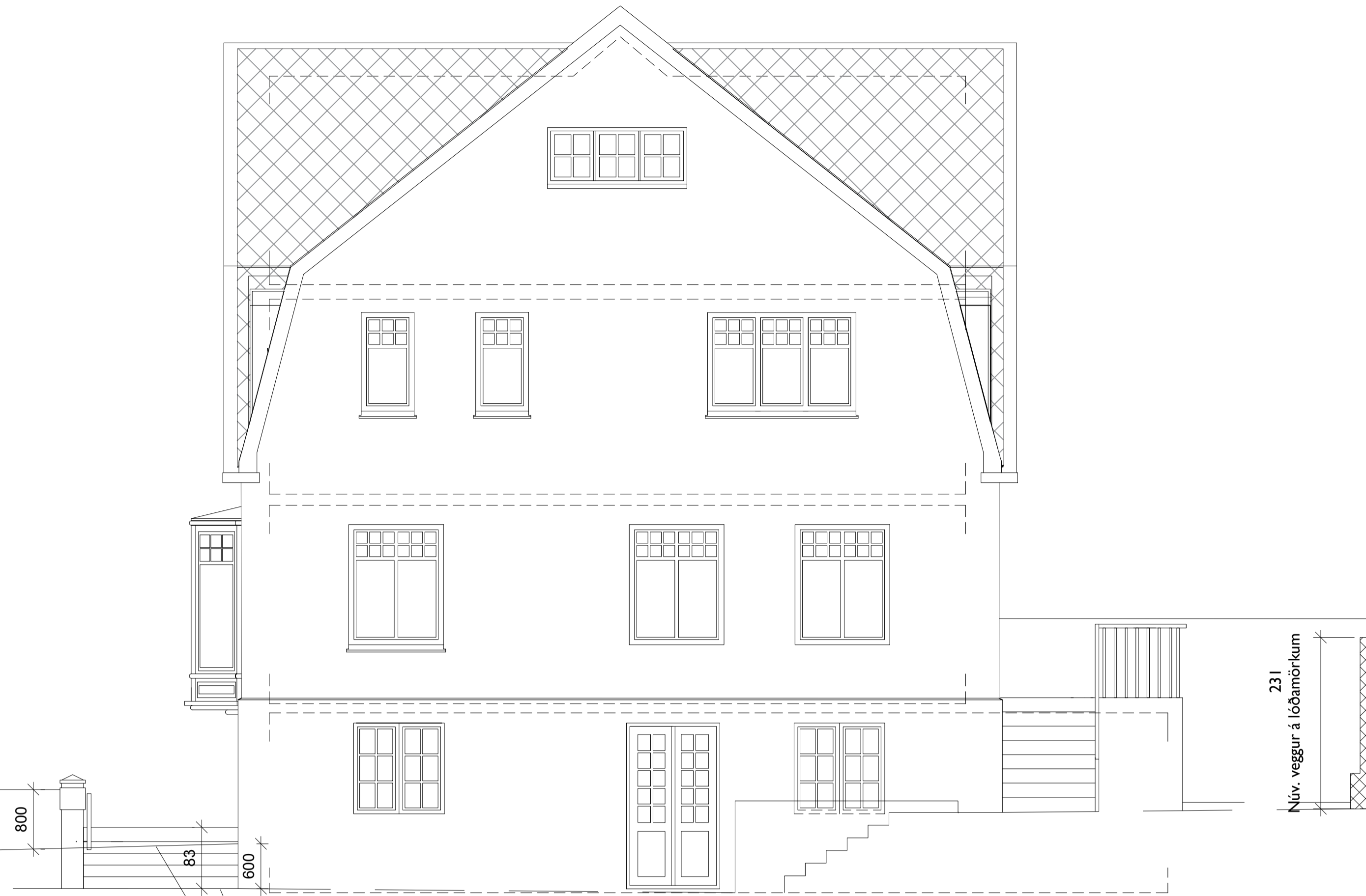
SUÐ-AUSTUR HLIÐ EFTIR BREYTINGAR 1:50

Lóð eftir breytingu-Mesta lækkun garðs á lóð