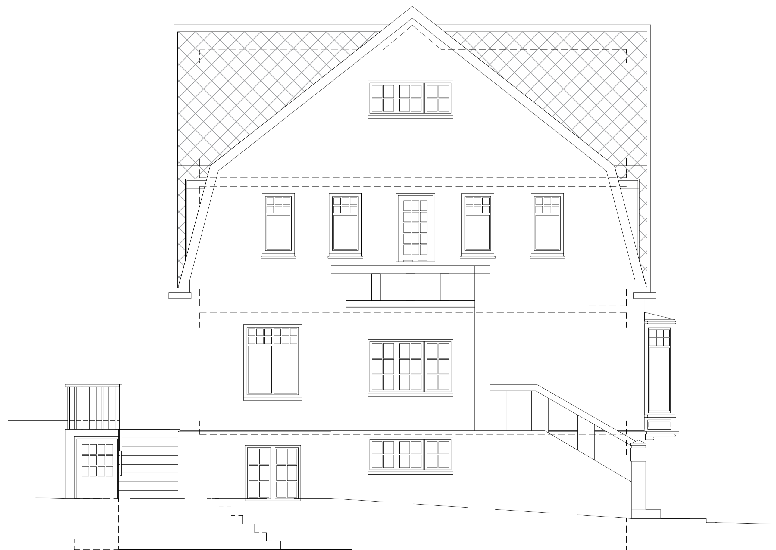
NORÐ-VESTUR HLIÐ EFTIR BREYTINGAR 1:50