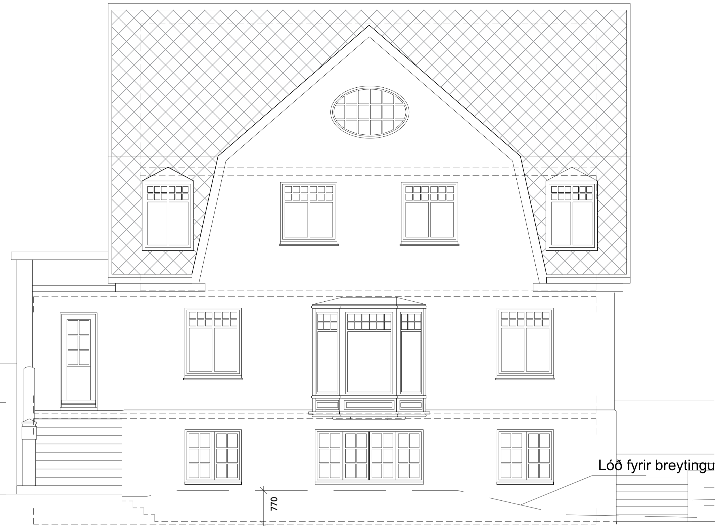
SUÐ-VESTUR HLIÐ EFTIR BREYTINGAR 1:50

Lóð eftir breytingu-Mesta lækkun garðs á lóð