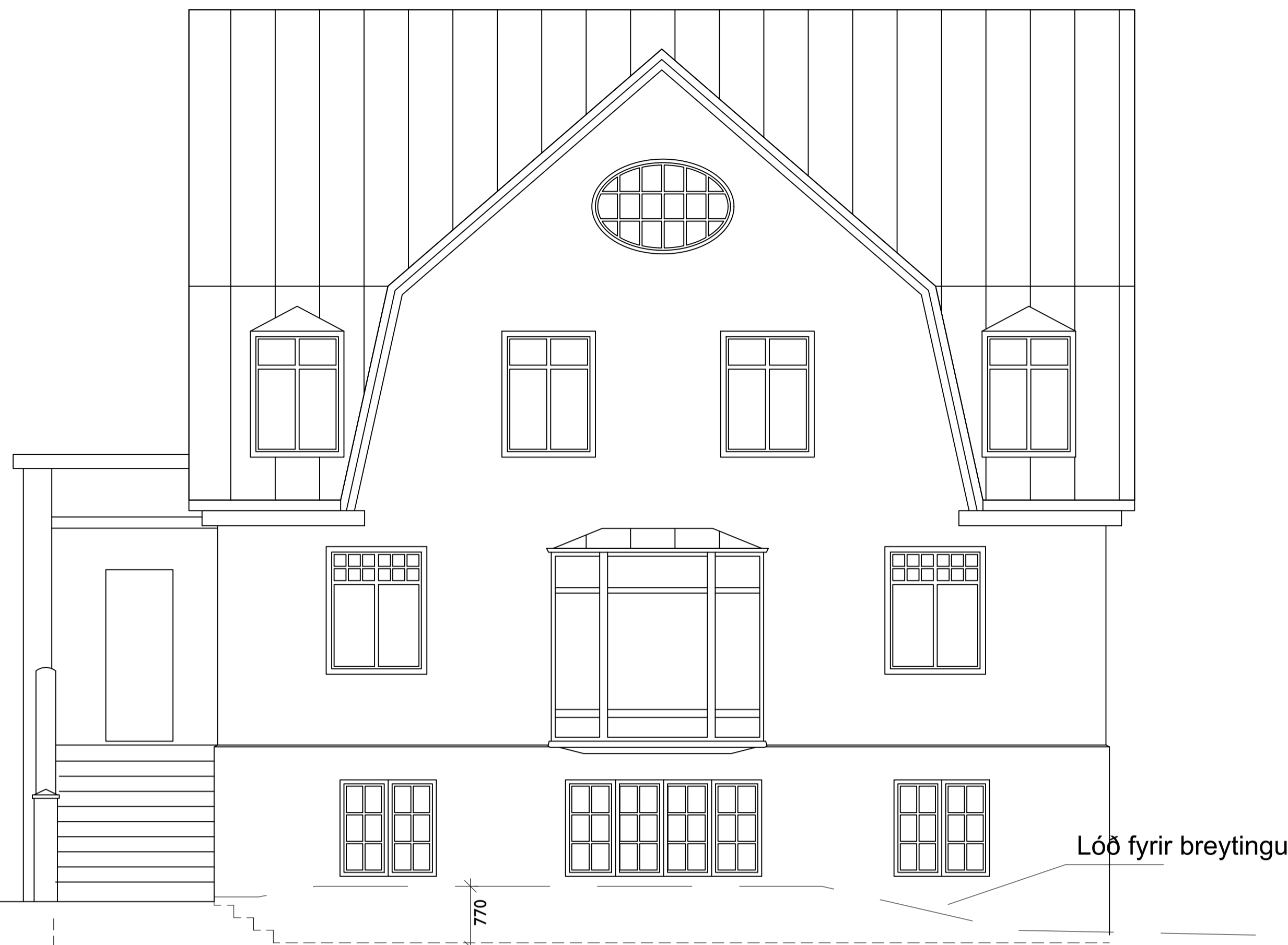
SUÐ-VESTUR HLIÐ FYRIR BREYTINGAR 1:50

Lóð fyrir breytingu Lóð eftir breytingu-Mesta lækkun garðs á lóð