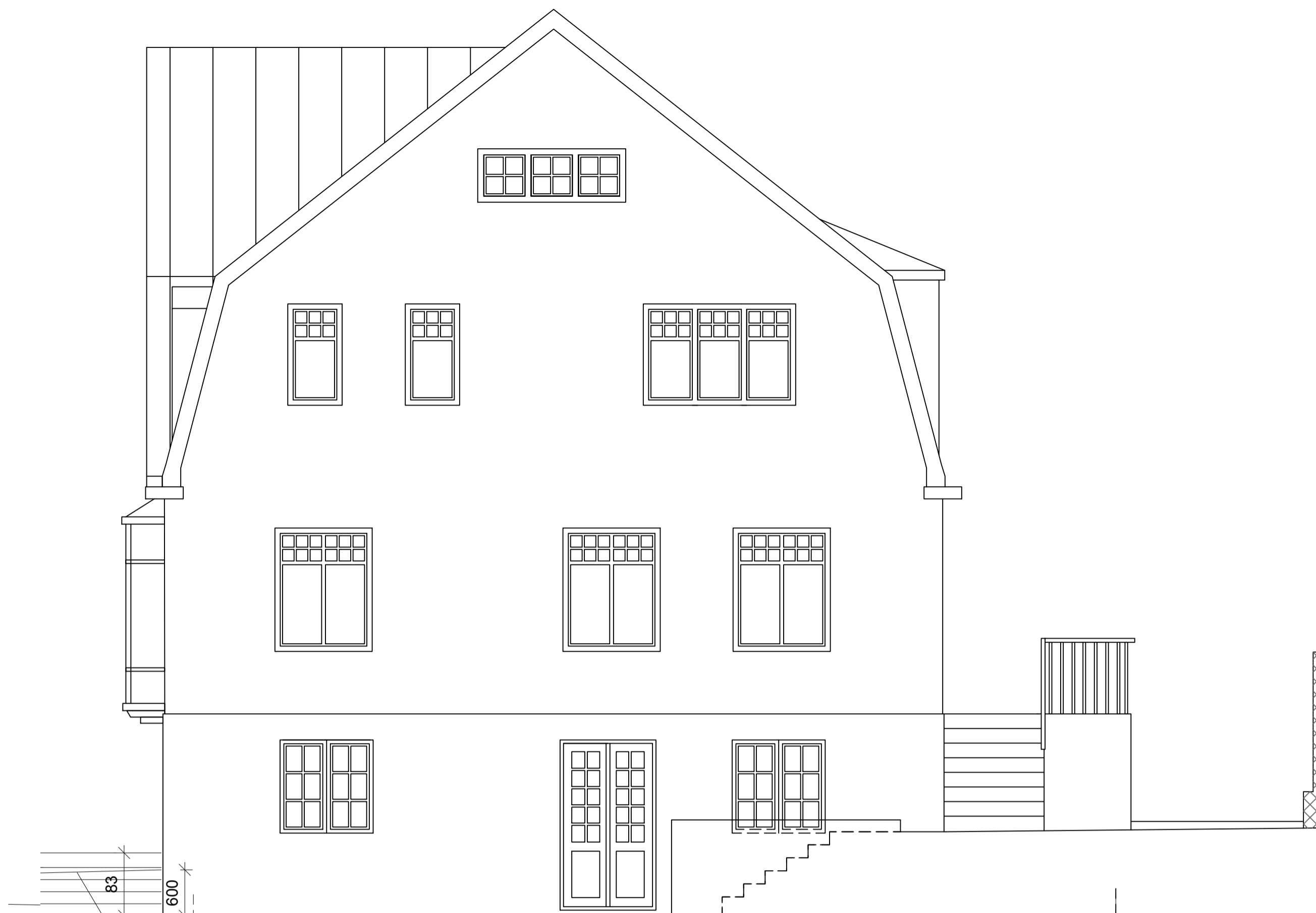
SUÐ-AUSTUR HLIÐ FYRIR BREYTINGAR 1:50

Lóð fyrir breytingu Lóð eftir breytingu-Mesta lækkun garðs á lóð