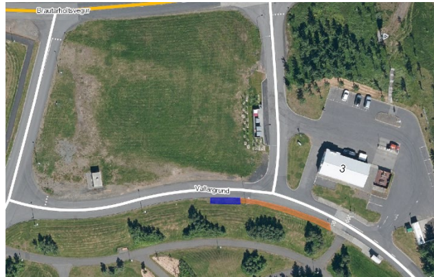
Mynd 2 - Tillaga að strætóstöð fyrir áætlunarleið við Vallargrund

Við Vallargrund er lagt til að gerð verði ný strætóstöð vestan tengivegs af Vallargrund á Brautarholtsveg, við Olís, ásamt gangstéttartengingu við stígakerfið nær því sem nú er strætóstöð. Tillaga að staðsetningu stöðvarinnar auðveldar Strætó að komast af og aftur á Vesturlandsveg eftir fækkun gatnamóta. Tillaga að staðsetningu er ekki fjarri núverandi stöð við Olís og myndi því ekki hafa teljandi áhrif á gönguleiðir að- og frá stöðinni. Kostur staðsetningarinnar er að íbúar þurfa ekki að fara yfir Vallargrund á leið sinni milli biðstöðvar og heimilis.