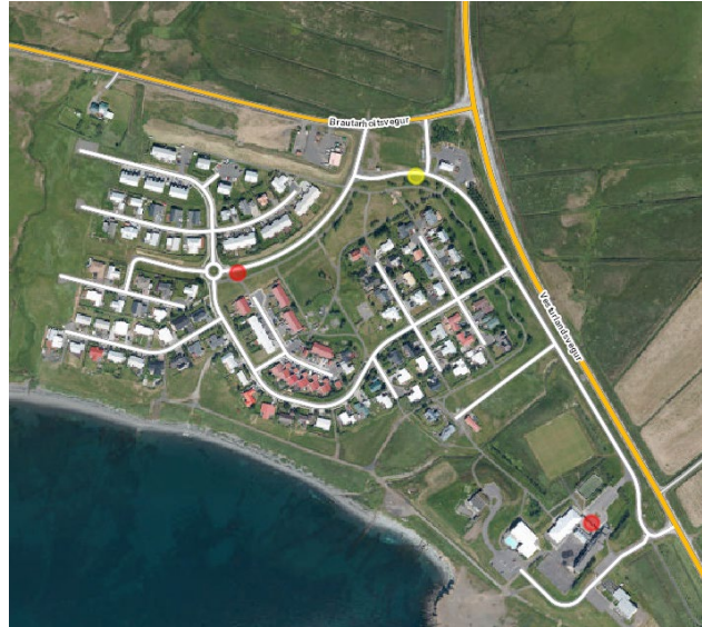
Mynd 1 - Lagt er til að stöð við gulan punkt verði þjónustuð af áætlunarleið Strætó, en stöðvar við rauðu punktana verði þjónustaðar eftir pöntun.

Lagt er til að útbúnar verði 3 nýjar stöðvar í stað þeirra á Vallargrund sem Strætó hyggst hætta að þjónusta. Breytingar á þjónustu Strætó eru tengdar við breikkun Vesturlandsvegur, en stefnt er að því að áætlunarleið stöðvi við nýja stöð á Vallargrund við Olís og að útbúnar verði 2 strætóstöðvar sem þjónustaðar væru af pöntunum.