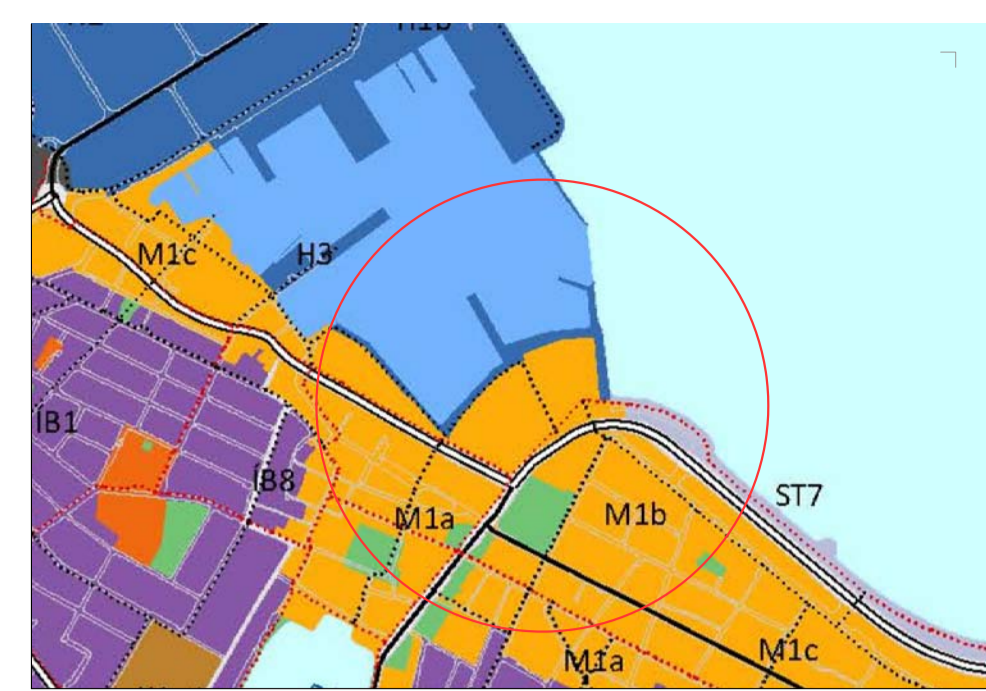
Aðalskipulag Reykjavíkur 2010 - 2030.

Breytingin felst í eftirfarandi: 1. Skipulagsreitir er minnkaður um 451m 2 við það að skipulagsmörk í Pósthússtræti eru færð nær lóðinni Austurbakka 2 þannig að þau liggja 3 metra frá lóðarmörkum.