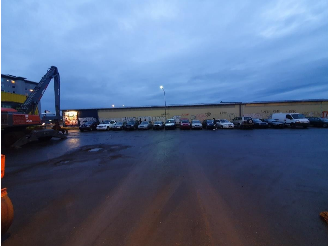
Mynd tekin í júlí 2021

Vegna athugasemdar HER árið 2020 um að Vaka sé komin út fyrir lóðamörk, þá tók Vaka ákvörðun um að taka þá gáma sem eru fyrir utan lóðarmörk til að bæta ásýnd fyrirtækisins. Mynd tekin í desember 2020.