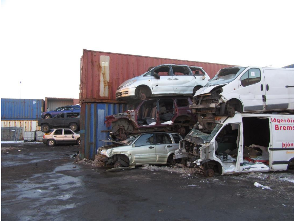
Mynd tekin með sama sjónarhorni í júlí 2021