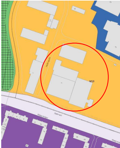
Aðalskipulag Reykjavíkur 2010-2030

Á embættisafgreiðslufundi skipulagsfulltrúa 16. júlí 2021 var lagður fram tölvupóstur Heilbrigðiseftirlits Reykjavíkur dags. 15. júlí 2021, þar sem óskað er umsagnar skipulagsfulltrúa um starfsleyfi Vöku hf. fyrir bílapartasölu. Einnig lögð fram greinargerð vegna umsóknar um starfsleyfi dags. 5. júlí 2021 og greinargerð um breytingar á starfsemi Vöku dags. 5. júlí 2021. Fyrirspurninni var vísað til umsagnar verkefnisstjóra og er nú lögð fram að nýju ásamt umsögn skipulagsfulltrúa dags. 20. júlí 2021.