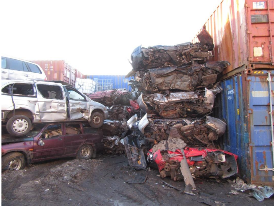
Mynd með sama sjónarhorni tekin í júlí 2021

Í porti suðvestanmegin var bílum staflað upp á margar hæðir, mynd tekin vorið 2020.