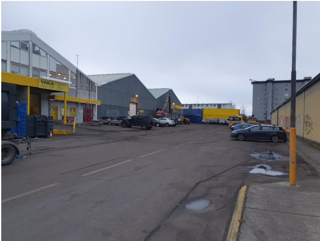
Mynd tekin í júlí 2021

Ásýnd félagsins hefur batnað til muna, búið er að taka alla gáma af lóðarmörkum. Mynd tekin 14. desember 2020.