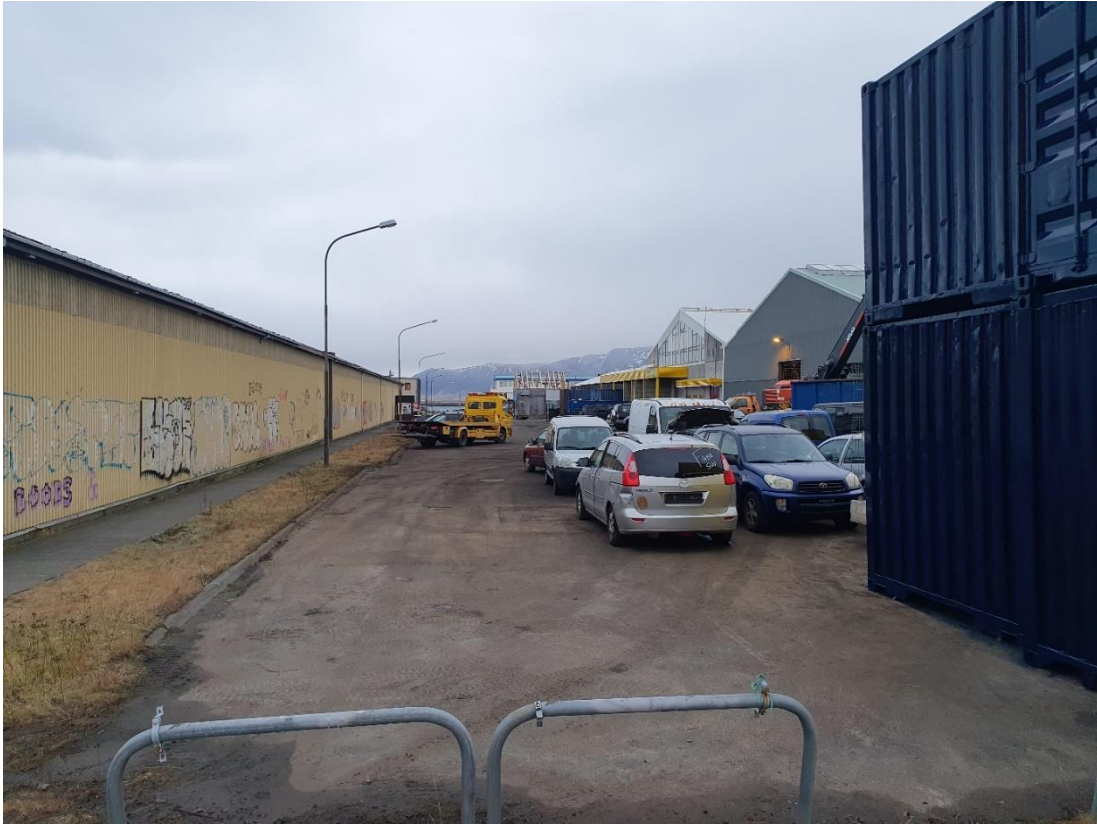
Mynd tekin í júlí 2021