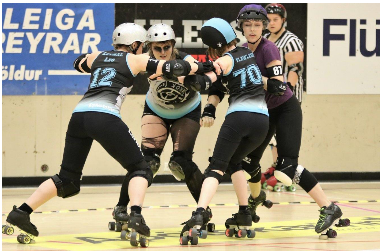
Ragnarök - Royal City Roller Girls (10.03.18)