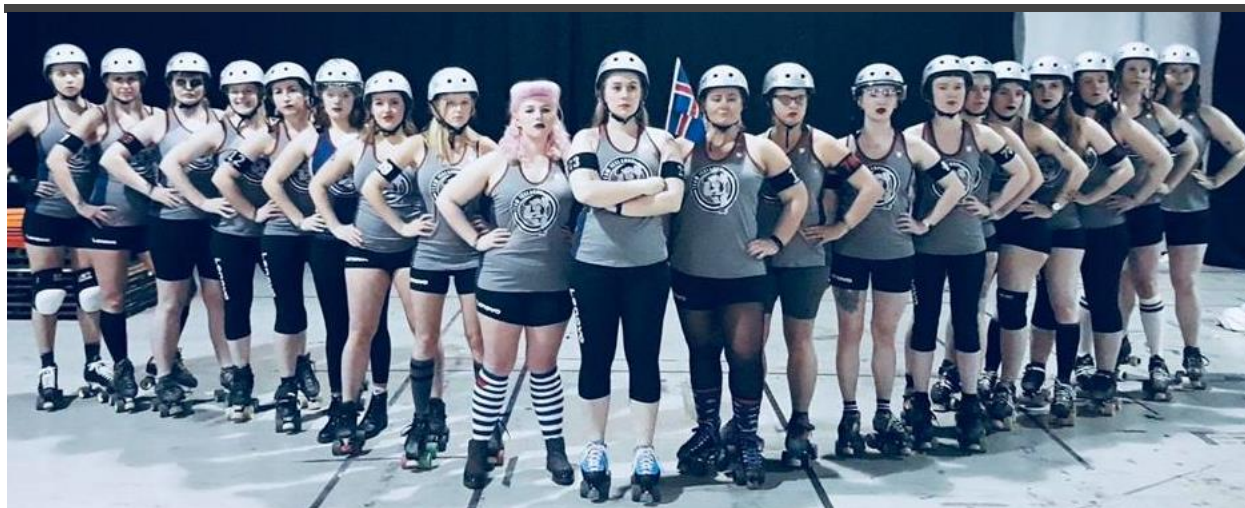
Team Iceland á heimsmeistaramótinu 2018