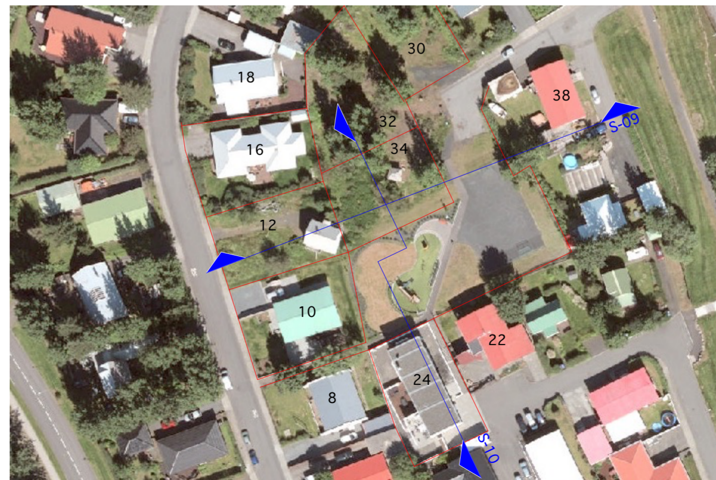
Loftmynd sýnir skurði / m, 1:1000