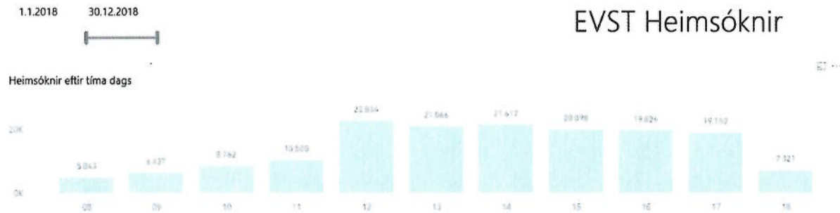
Mynd 2. Mælaborð EVST. Fjöldi heimsókna á Breiðhelli árið 2018, skráð sem fjöldi á klst.

Launakostnaður vegna þessarar breytingar er áætlaður 11,8 milljónir á ársgrundvelli.