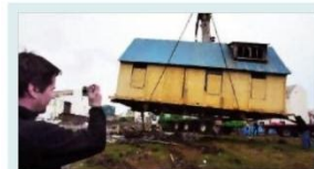
Vertakur koma Ívarseli fyrir uppi á flutningabil í gærkvöldi, en húsið lagði af stað upp að Árbæjarsafni í nótt.