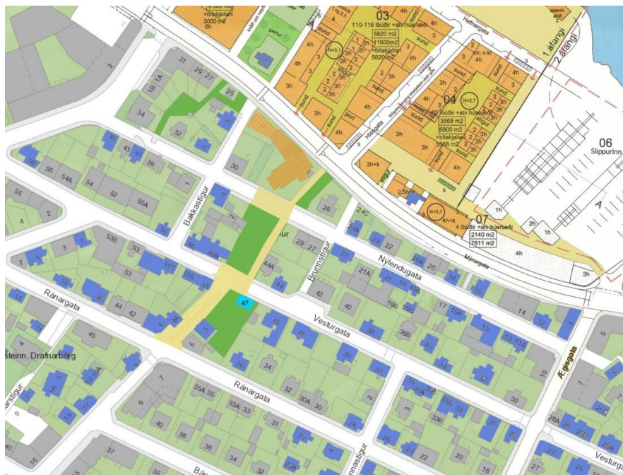
Grunnmynd sem sýnir umræddar lóðir með Ívarsseli á Vesturgötu 47 og tengingu við lítinn leikvöll og fyrirhugaðar byggingar við sjávarsíðuna.