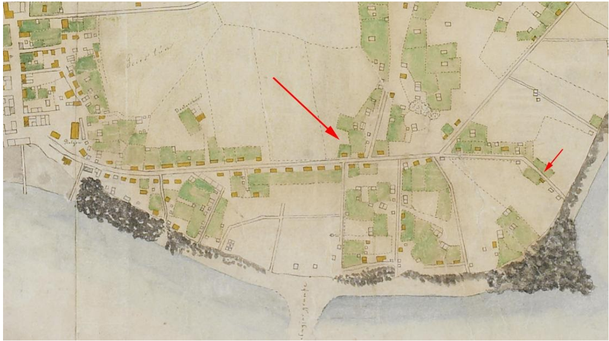
Uppdráttur frá 1887 sýnir húsin á Vesturgötu 45, 47 og 51 (49 var ekki til). Ívarssel lengst til hægri.