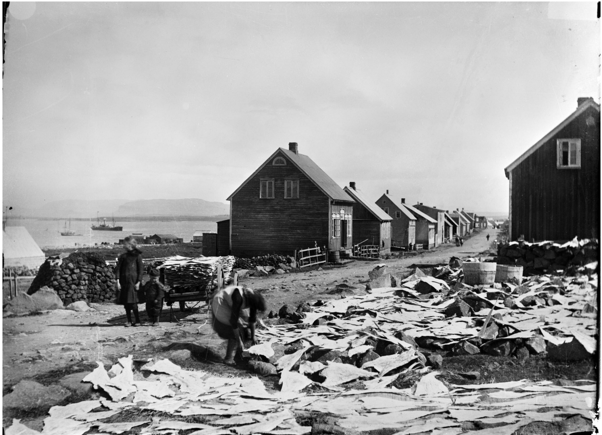
Ljósmynd frá 1890: Vesturgata 51 til hægri og Vesturgata 44 vinstra megin götunnar. Trúlega sést í húsið Nýlendu lengst til vinstri (er á Árbæjarsafni).