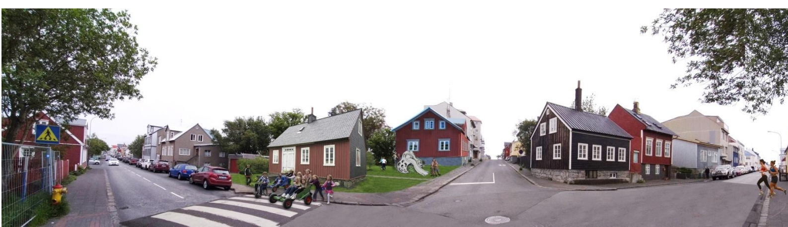
Samsett mynd sem sýnir Ívarssel á lóðinni og hugmynd af gaffli á Bræðraborgarstíg 3.

Gott pláss yrði einnig fyrir minnisvarða um brunan og fórnarlömbin.