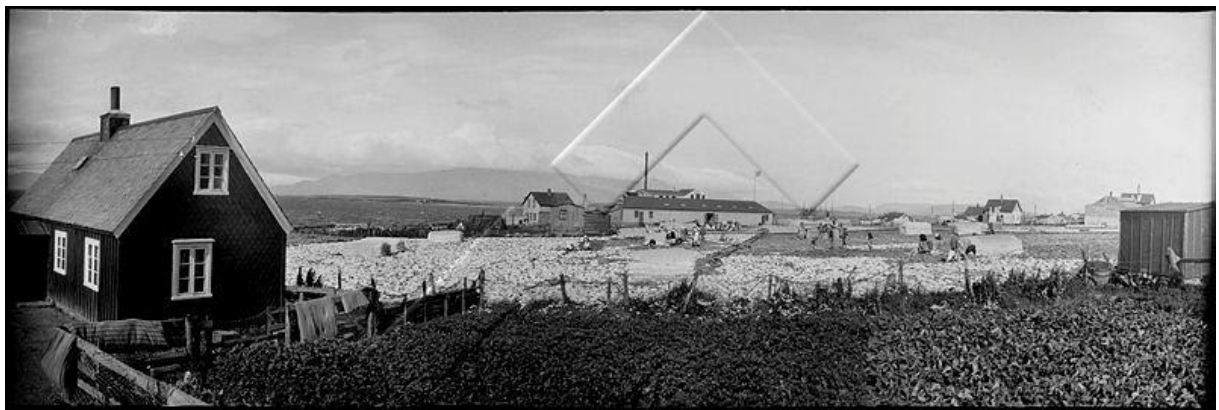
Ívarssel til vinstri var byggt 1869 stóð við Vesturgötu 66b og er nú á Árbæjarsafni.