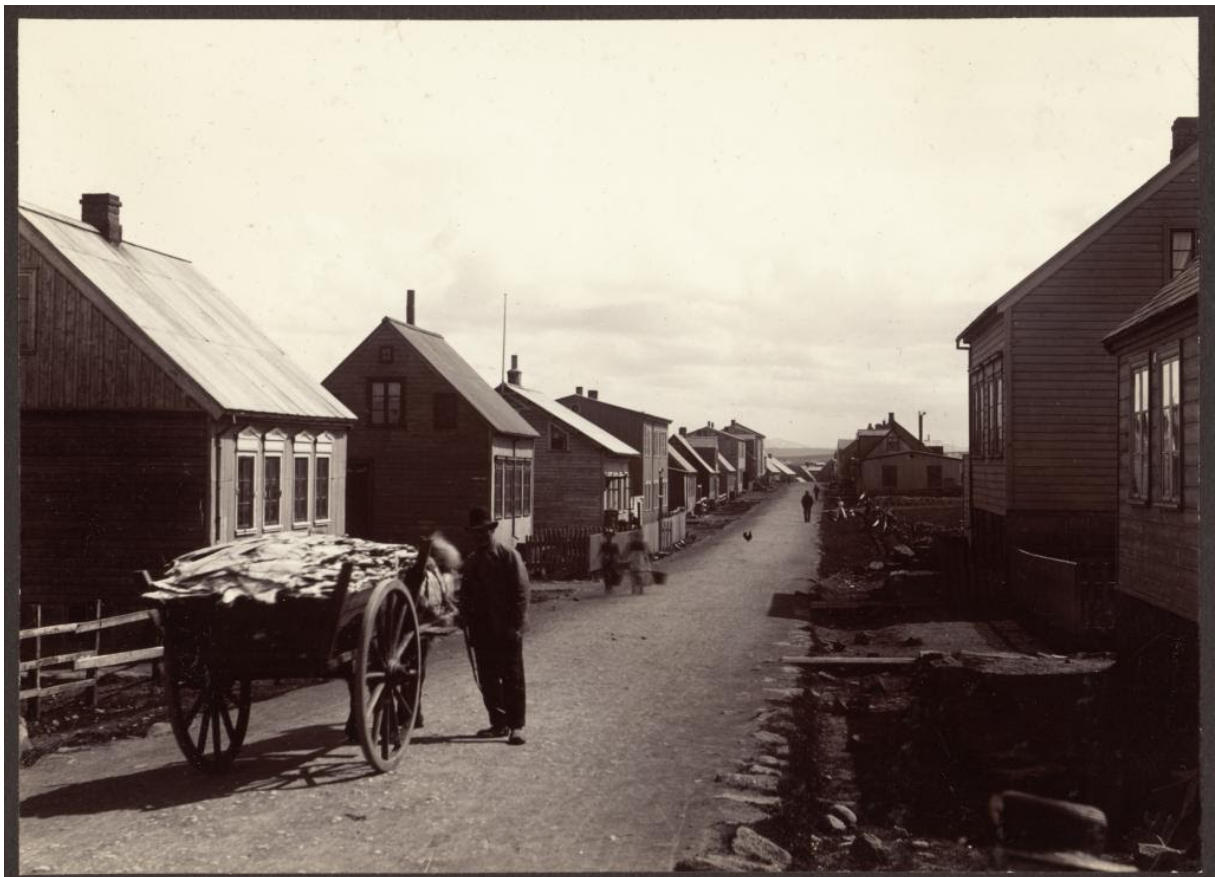
Ljósmynd : Til hægri Vesturgata 45 og Vesturgata 47 sem stóðu á lóð sem nú heitir Bræðraborgarstígur 1.