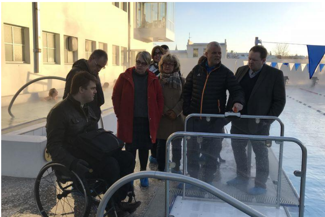
Ferlinefnd skoðar nýja lyftu sem sett var upp í Sundhöll Reykjavíkur.

Árið 2014 færðist umsjón með starfsemi nefndarinnar til mannréttindaskrifstofu. Starfsmaður nefndarinnar kemur frá skrifstofunni og situr mannréttindastjóri Reykjavíkurborgar jafnframt fundi nefndarinnar. Óskað var eftir tilnefningum frá sömu hagsmunaaðilum og 2010 en við nefndina bættist fulltrúi frá minnihluta í borgarstjórn.