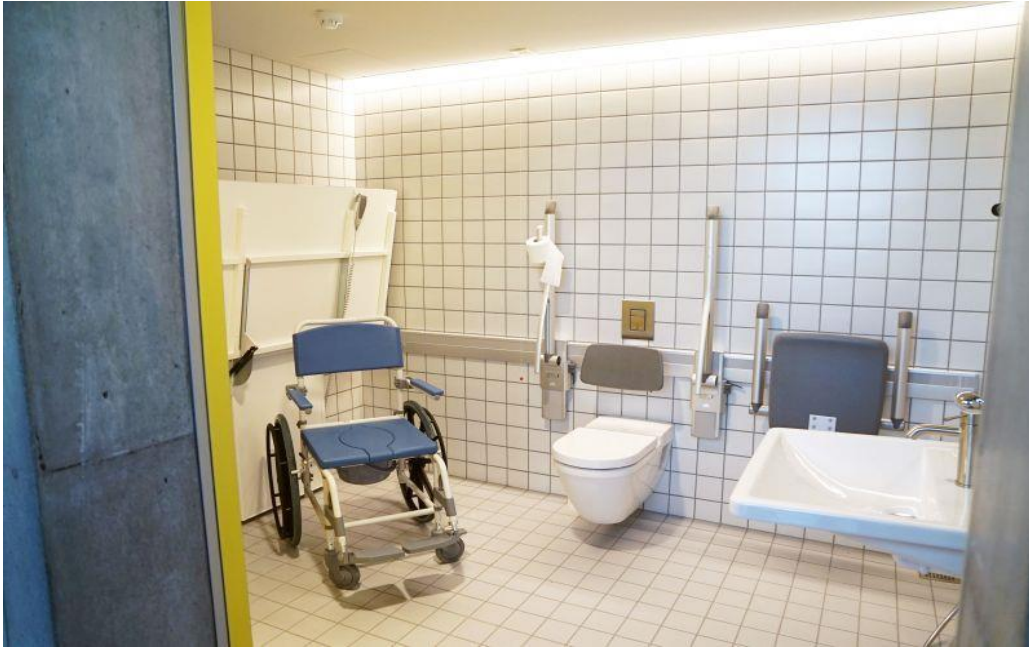
Nýr aðgengilegur sérklefi í Sundhöll Reykjavíkur

Ferlinefnd fundaði 16 sinnum á árinu 2017. Nefndin tók til umfjöllunar framkvæmdir á 17 starfsstöðum Reykjavíkurborgar. Sex grunnskólum, fimm leikskólum, þremur sundlaugum, einu safni og einni félagsmiðstöð aldraðra. Við átta þessarra staða voru sett upp P-merkt bílastæði og var ferlinefnd þá til umsagnar um staðsetningu, hönnun, fjölda og merkingu staðanna. Töluvert var um óskir um úrbætur á inngangi og í fimm tilfellum var óskað eftir rafmagnsopnunum á hurðir. Yfirlit yfir framkvæmdir sem ferlinefnd hafði aðkomu að má sjá hér á eftir. Í einhverjum tilfellum var ferlinefnd aðeins til umsagnar en í flestum tilfellum lagði hún jafnframt til fjármagn vegna vegna framkvæmdanna.