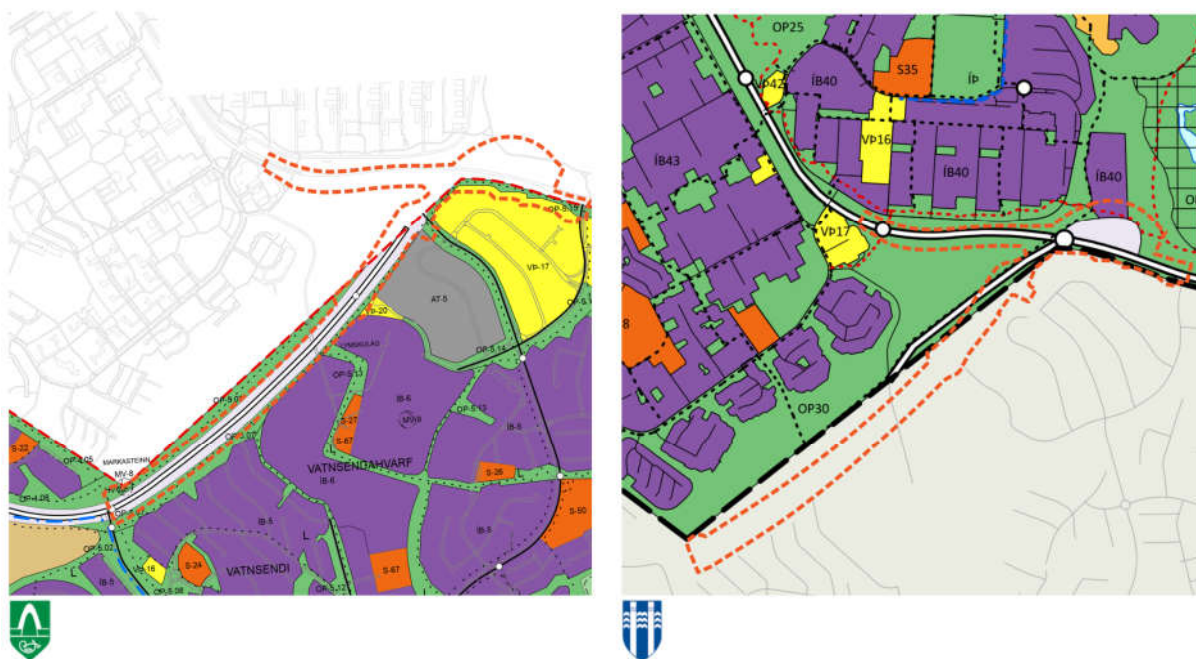
MYND 2 Staðsetning skipulagssvæðisins á gildandi aðalskipulagi Kópavogs 2019-2040 og gildandi aðalskipulagi Reykjavíkur 2010-2030, merkt gróflega með rauðri punktalínu.

Framkvæmdin hefur kallað á skipulagsbreytingu á Aðalskipulagi Reykjavíkur 2010-2030, þar sem framkvæmdin var ekki í samræmi við skipulagsmörk Elliðaárdals í Reykjavík. Viðkomandi aðalskipulagsbreytingar hafa verið gerðar í viðauka við aðalskipulag Reykjavíkur, samhliða deiliskipulagi Arnarnesvegur.