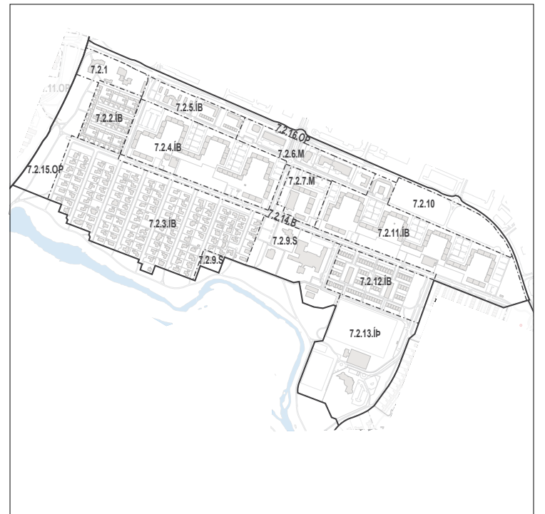
Skilmálaeiningar - skýringarmynd