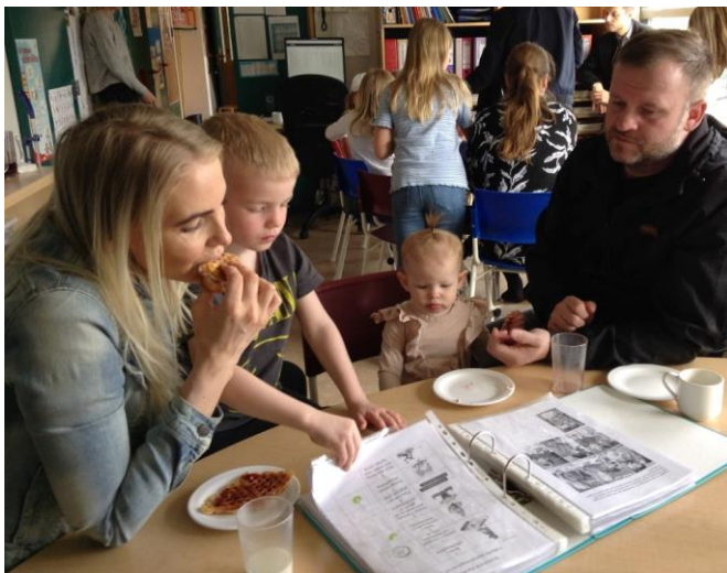
Foreldrar og systir í vöflukaffi.

Það sem best kom út var markmið og árangur (4,85), ímynd (4,69), stjórnun (4,66) og starfsánægja (4,65). Það sem hafði hækkað hvað mest milli ára (sjá mynd) var einmitt markmiði og árangur (+0,28). Að jafnaði kemur starfsumhverfi lakast út úr starfsmannakönnunum Ægisborgar og var lítil breyting þar á í þessari könnun. Það sem lakast þótti var vinnuaðstaða (3,38) og hæfilegt vinnuálag (3,41). Það sem lækkaði mest milli ára (sjá mynd) var fræðsla og þjálfun (-0,38) og starfsandi (-0,31). Niðurstöður könnunarinnar kalla ekki á stórfelldar breytingar en enn er bent á ófullnægjandi vinnuaðstöðu og vinnuumhverfi, sem kallar á viðbrögð stjórnenda. Aukinheldur er dalandi starfsandi og fræðsla eitthvað sem þarfnast skoðunar. Afar mikilvægt að huga í sífellu að starfsumhverfi í Ægisborg.