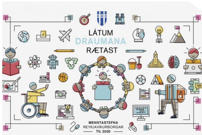
Látum draumana rætast – Menntastefna Reykjavíkurborgar til 2030.

meðvitað um stöðuna. Barnahóparnir eru stórir á hverri deild og sem dæmi má nefna að Ægisborgarar geta hvergi komið saman innan húss allir í einu, engin aðstaða er fyrir aðstoðarleikskólastjóra, börn geta illa fundið sér næði, kaffistofan er sprungin, hvergi er gert ráð fyrir matarvögnum og engin fundaraðstaða er til staðar. Ægisborgin er barn síns tíma, eldri deildirnar hýstu upphaflega leikskólabörn sem dvöldu 4-5 stundir í leikskólanum og einungis var eldað fyrir börn