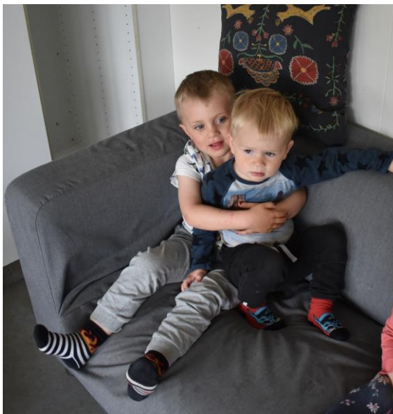
Aðlögun í Koti. Þegar ungur byrjar hjálpa eldri.

Samverustundirnar í Kotinu eru tvær í dagskipulaginu. Fyrir hádegismat er söngstund, en þá syngjum við saman eða börnin fá að koma fram og syngja einsöng eða í litlum hóp fyrir hin börnin. Farið er með þulur og stundum lesið ef stundin er í lengra lagi. Eftir síðdegishressingu er lestrarstund, þá er börnunum skipt eftir aldri og lesnar bækur við hæfi hvors hóps. Í haust tók ekki langan tíma að koma