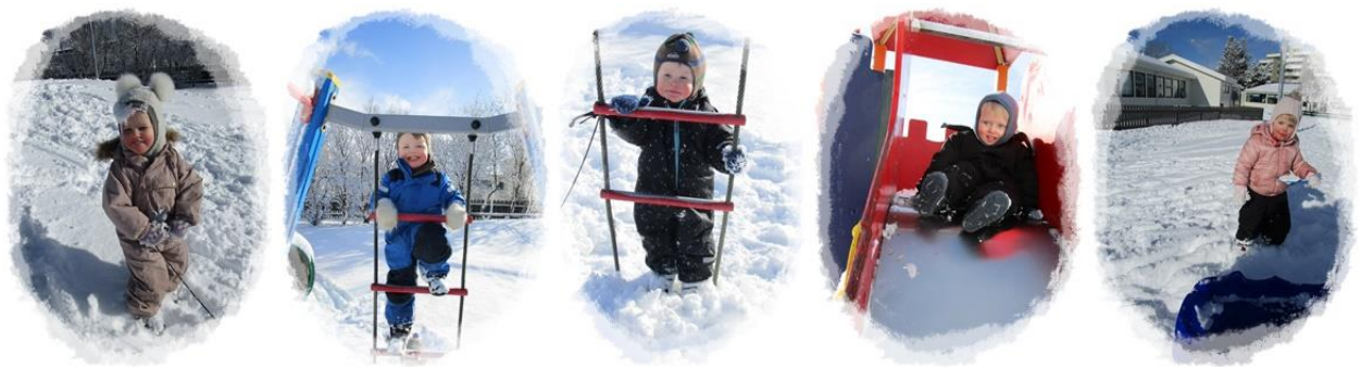
Útivera í snjónum. Börn af Fjörudeild að leik.

Góðir hlutir gerast hægt og svo sannarlega gleðjast Ægisborgarar yfir því að hafin er endurgerð garðsins, sem lengi hefur verið beðið eftir. Börn, starfsfólk og garðhönnuðir lögðu saman í hugmyndabanka endurgerðarinnar og verkið verður unnið í sumar og það næsta. Ægisborgarar deila nú garðinum með stórvirkum vélum og duglegum vinnumönnum sem byrjuðu reyndar á að brjóta og bramla svo börnunum stóð ekki á sama. Varð einum drengnum að orði þegar honum ofbauð aðfarirnar: Hver bað eiginlega um þetta?