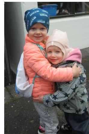
Frænkur hittast á útisvæði.

Numicon-kubbar voru notaðir meira en áður, bæði með öðrum efnivið og einir og sér. Í umbótaáætlun fyrir næsta skólaár verður lögð áhersla á stærðfræðitengt efni í leiknum. Leikskráningum seinkaði allverulega en nú eiga öll börnin á deildinni sína skráningu. Í söngstundum hefur tekist vel að samræma texta sem við kennum börnunum. Notast er meira við sönghefti og nýtt og öflugra sönghefti er á leiðinni. Það hefur verið erfitt að koma á reglulegum deildarfundum og að stórum hluta er það vegna álagsins. Á Fjörudeild tókst að hafa 11 deildarfundir frá september til maí. Langir og góðir fundir sem náðust á skipulagsdögum gerðu það að verkum að vel má við una.