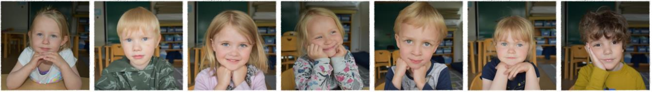
Rithöfundar á Bárudeild.