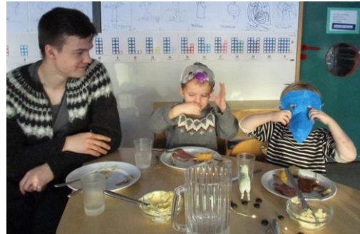
Á þorablóttinu í vetur. Mynd af Bárudeild.

Einnig skipti máli að eiga notalega samveru sem hefur mikið að segja fyrir starfsandann. Auk þess skipti miklu máli að allir væru að fá sömu upplýsingar á sama tíma.