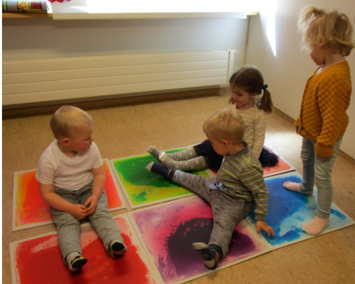
Litaskynjun á Fjörudeild.

Aðlögun barna og foreldra gekk vel og voru langflestir orðnir nokkuð öruggir með sig mánuði seinna. Til að byrja með voru þrír starfsmenn á deildinni og sá fjórði bættist við eftir miðjan september. Mannabreytingar urðu um áramótin þegar einn starfsmaður hvarf á braut og nýr kom inn, en segja má að þessar breytingar hafi gengið vel vegna góðrar festu og skipulagningar á deildinni.