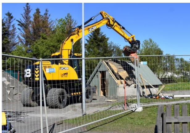
Hafist handa í garði Ægisborgar 23. maí 2019. Dótaskúrinn rifinn fyrir augum barnanna.

Látum draumana rætast er heiti nýrrar menntastefnu Reykjavíkurborgar til ársins 2030. Það er ánægjulegt að Reykjavíkurborg hefur metnað til að bæta líðan og nám barnanna í borginni og leggur til þess bæði fræðslu og fjármagn. Ægisborgarar völdu að byrja á vinnu með sjálfseflingu og munum við vinna að hluta til í samvinnu við Gullborg og Grandaborg og hafa skólarnir gert samning við menntafyrirtækið KVAN varðandi fræðslu til starfsmanna og foreldra. Við horfum með tilhlökkun til samstarfsins og síðan er á döfinni að tengja þessa vinnu við námsferð sem Ægisborgarar stefna að í apríl 2020. Þá er ætlunin að fara til Berlínar, skoða skóla og sitja námskeið sem tengist menntastefnuvinnunni.