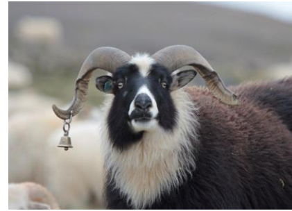
Ég sé um að þessi áætlun sé ærleg!

Á fundi í maí 2019 kom fram vilji leikskólanna til að gefa elstu börnunum gott tækifæri til að hittast og tengjast betur svo þau þekktust aðeins í upphafi Grandaskólagöngu. Jafnframt þurfa leikskólarnir og Grandaskóli að koma sér saman um hvaða upplýsingar flytjast milli skólanna og með hvaða hætti. Þessir liðir verða því umbótaþættir næsta vetrar.