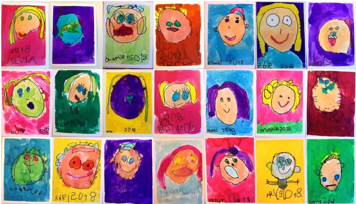
Sjálfsmyndir af Öldudeild