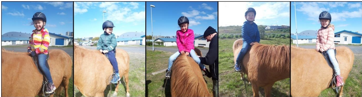
Elstu börnin í útskriftarferð, en þau fengu að hoppa á bak í heimsókninni í hesthúsið.