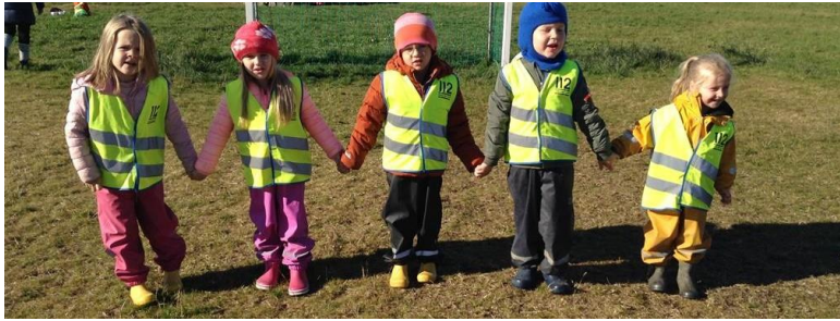
Hvað er klukkan gamli úlfur?

Veturinn 2019-2020 verður sjálfsefling í brennidepli starfsins og á að tengjast sem best allri nálgun kennara við starfið. Til að glöggva okkur á þeim aðferðum sem best duga í því sambandi verður unnið með