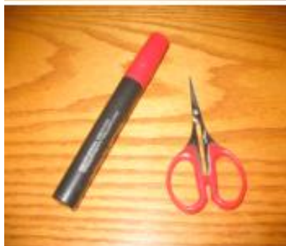
Úr myndasafni sérkennslunnar. Tvö nafnorð.

Verkefni sérkennsludeildar hverju sinni helgast af þeim börnum sem eru í Ægisborg þá stundina og því sem þau þarfnast aðstoðar við. Liðið starfsár voru 14 skilgreindir sérkennslutímar í Ægisborg sem skiptust á milli tveggja barna. Verkefnin voru margvísleg, meðal annars fylgd í þjálfun og vöktun vegna bráðalvarlegs sjúkdóms, fyrir utan einstaklingsvinnu og hjálpar í hóp með jafnöldrum. Starfsfólk sérkennslu, aðrir starfsmenn og foreldrar hafa orðið vitni að heilmiklum framförum og óskum við börnunum velfarnaðar í komandi verkefnum. Sérkennslan hefur verið fjölbreytt og margt rifjað upp sem áður var notað m.a. við kennslu einhverfra barna. Auk þess sem við höfum notað færnimatið ABLLS og AEPS fyrir nokkur börn.