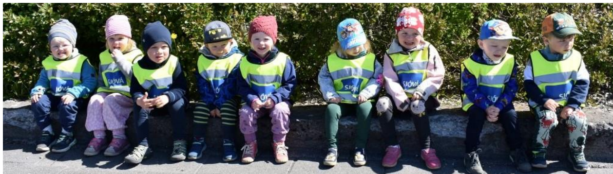
Stórir Kotverjar tylla sér í útskriftarferðinni.