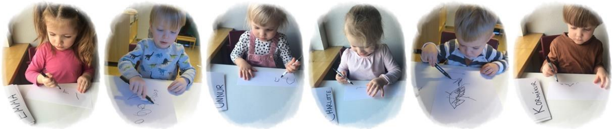
Fjörubörn skrifa og teikna sjálfsmýndir.