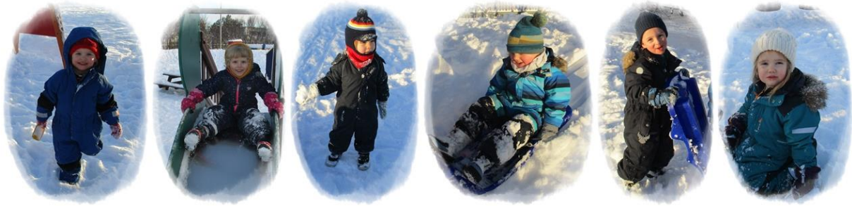
Bárubörn í snjónum í vetur.