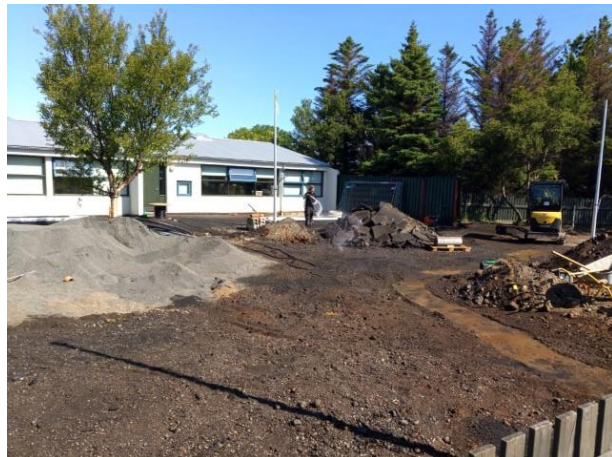
Úrbætur á lóð Ægisborgar í fullum gangi 11. júní 2019.

Foreldrar eru alltaf velkomnir í Ægisborg en nokkrir viðburðir eru sérstaklega þeim ætlaðir og til þess gerðir að efla samskipti heimilis og skóla. Eftirtaldir viðburðir voru liðið ár og má finna á skólalagatali þess næsta. Hæst ber foreldravíkuna , þar sem foreldrar eru hvattir til að koma í Ægisborg og taka þátt í leik barnsins um styttri eða lengri tíma. Foreldravikan var 7.-11. janúar 2018. KR-sýning var 17. maí þar sem foreldrar tóku þátt í hreyfistarfi barnsins og var þar um að ræða sýningu á vetrarstarfinu í íþróttahúsinu. Vetrarstarfið var að venju sýnilegt í vöflukaffi sem var 8. maí. Karlakaffi , konukaffi og aðventukaffi eru fastir liðir í samskiptum heimilis og Ægisborgar.