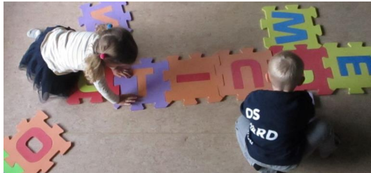
Stafasúpa á Fjörudeild.

Að treysta og spinna vináttuböndin á unga aldri er undirbúningur fyrir vináttu framtíðarinnar.