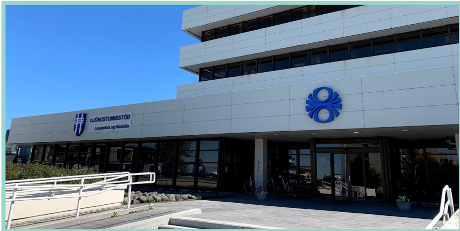
Þjónustumiðstöð Laugardals og Háaleitis service center / urząd miasta Efstaleiti 1, 103 Reykjavík