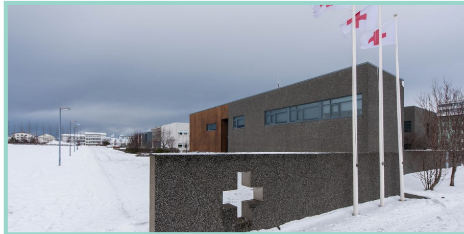
Rauði krossinn red cross / czerwony krzyz Efstaleiti 9, 103 Reykjavík