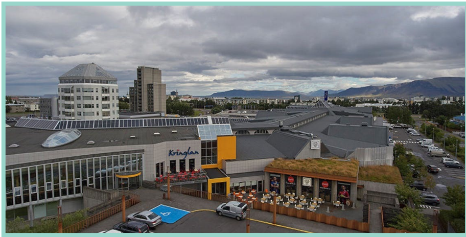
Kringlan shopping mall / centrum handlowe Kringlunni 4-12, 103 Reykjavík