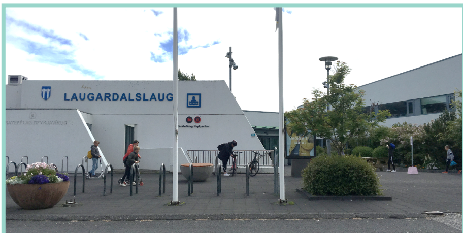
Laugardalslaug pool / basen Sundlaugavegur 30, 105 Reykjavík