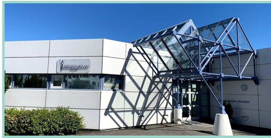
Heilsugæslan Efstaleiti health clinic / Przychodnia zdrowotna Efstaleiti 3, 103 Reykjavík