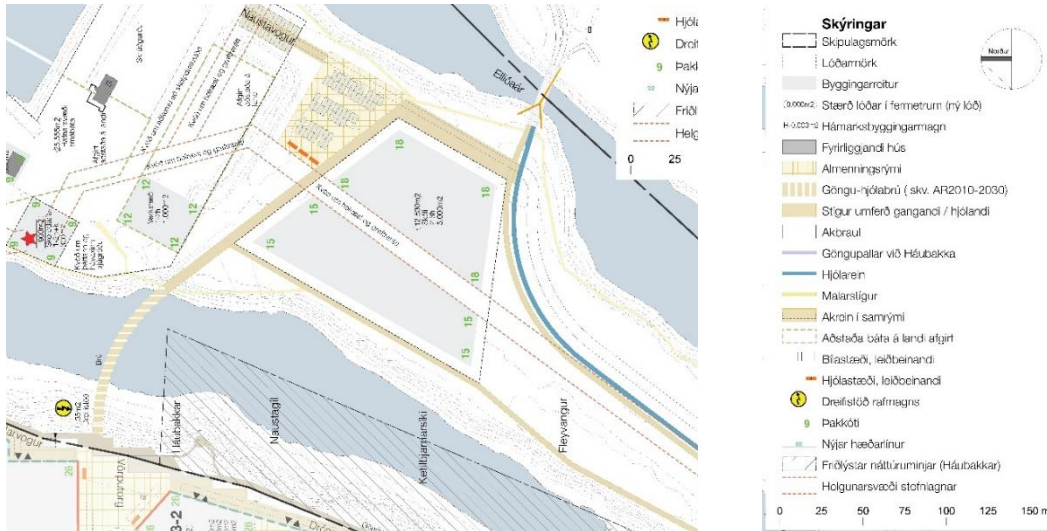
Deiliskipulagsuppráttur fyrir skólalóðina.

Til stendur að setja hönnun skóla fyrir Vogabyggð, staðsettan á Fleyvangi, í hönnunarsamkeppni. Í gildi er deiliskipulag, Vogabyggð svæði 5, sem samþykkt var í Skipulags- og samgönguráði þann 6. mars 2019 og í Borgarráði þann 14. mars 2019, með síðari breytingum. Í því deiliskipulagi er gerð tillaga að lóð og byggingarreit, byggingarmagni og þakkóta skólabygginga.