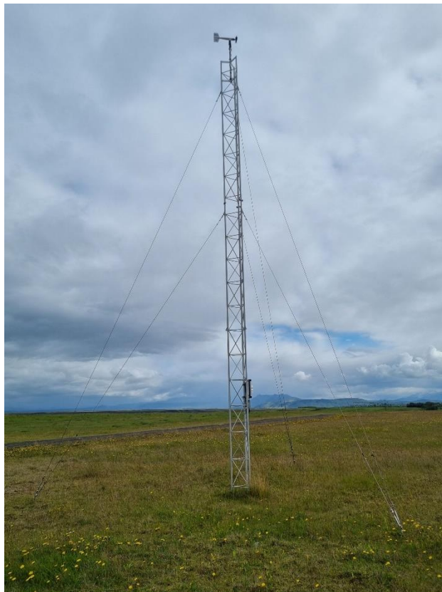
Mynd 2: Sambærilegt mastur með veðurmæli