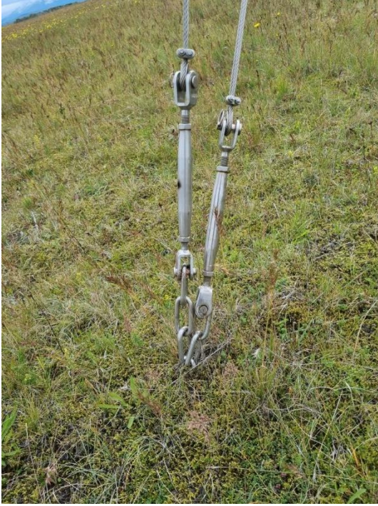
Mynd 3: Stagfesting masturs.