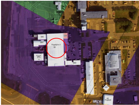
Aðalskipulag Reykjavíkur 2040

Á embættisafgreiðslufundi skipulagsfulltrúa 9. nóvember 2023 var lögð fram fyrirspurn Bjargfasts ehf./Hilmars Á Hilmarssonar, dags. 12. september 2023, um breytingu á notkun hluta hússins á lóð nr. 58 við Nauthólsveg úr skrifstofu í svefnaðstöðu og sameiginlega eldhúsaðstöðu fyrir starfsmenn vallarins, samkvæmt uppdr. M11 arkitekta, dags. 12. september 2023.