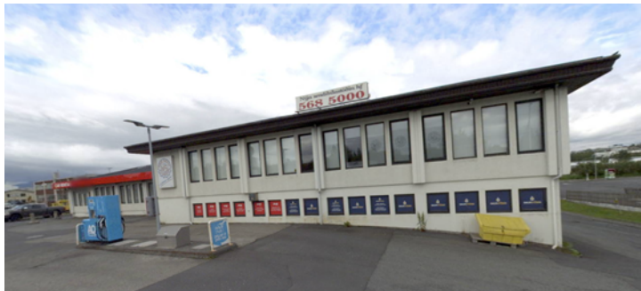
Götumynd tekin af kortasjá já.is