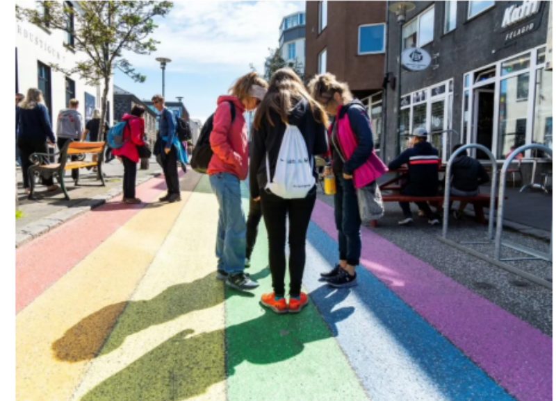
Young people on Skólavörðustígur -myjandi.is

Young Ambassadors is a joint project between Reykjavik City and Wrocław, Poland. Both cities are members of the Council of Europe's, Intercultural Cities network .