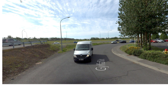
Horft frá Gylfaflöt að Strandvegi eftir slóðanum ( www.ja.is )