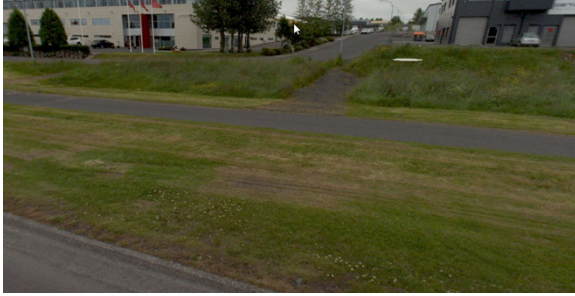
Horft frá Strandvegi að Gylfaflöt eftir slóðanum ( www.ja.is )