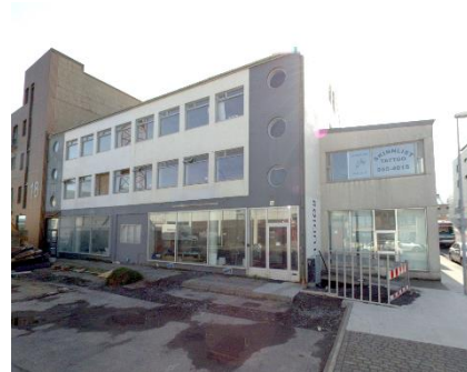
Ásýnd frá götu.