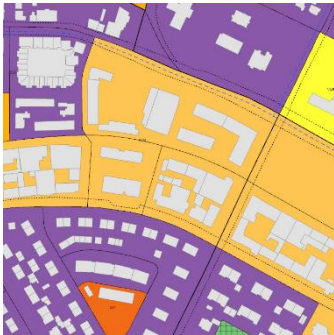
Aðalskipulag Reykjavíkur 2040.

Á embættisafgreiðslufundi skipulagsfulltrúa 11. apríl 2024 var lagt fram erindi frá afgreiðslufundi byggingarfulltrúa frá 9. apríl 2024 þar sem sótt er um leyfi til að hækka rishæð, fjarlægja austara stigahús, breyta gluggum, byggja svalir, koma fyrir lyftu og innrétta gististað í flokki II, teg. b, 32 gistirými fyrir 70 gesti á efri hæðum, verslunarrými á jarðhæð og sameina mhl. 02 og 03 og innrétta tvær vinnustofur og sorpgeymslu í bakhúsi á lóð nr. 16 við Brautarholt, samkvæmt uppdráttum Nordic Office Of Architecture, dags. 22. mars 2024. Einnig eru lagðir fram skuggavarps- og skýringaruppdrættir, ódags. Erindinu var vísað til umsagnar verkefnisstjóra og er nú lagt fram að nýju ásamt umsögn skipulagsfulltrúa dags. 11. júlí 2024.