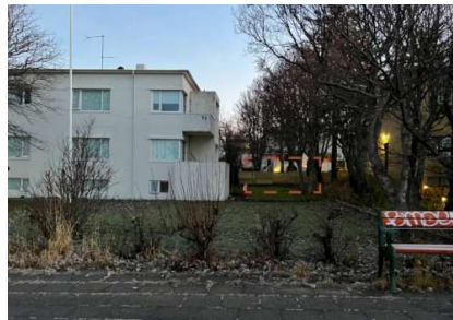
Staðsetning bílskúrs séð frá götu