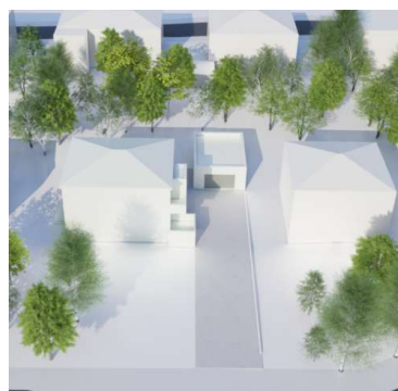
3D skuggavarp maí/sept kl. 16:00