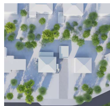
3D skuggavarp maí/sept kl. 16:00