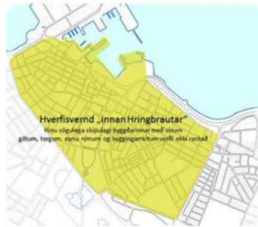
Hverfisvernd innan Hringbrautar