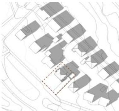
Skuggavarp maí/sept kl. 16:00