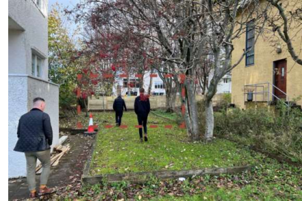
Fyrirhuguð staðsetning bílskúrs