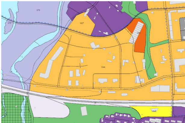
Aðalskipulag Reykjavíkur 2040.

Meðfylgjandi er undirskrift ábúanda/leigutaka dags. 02.12.2022, samkomulag við Veitur ohf. vegna lagningar jarðstrengja ásamt dreifistöðvar dags. 02.12.2022 og áformálýsing hönnuðar dags. 05.12.2022