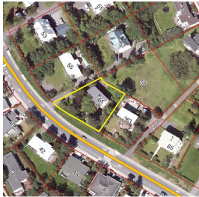
Loftmynd af Laugarásvegi 61.