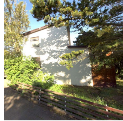
Ásýnd húss frá vesturhlið, ja.is 2022.