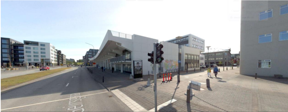
Efsta mynd sýnir norðurhlið mót austri þar sem gert var ráð fyrir hraðbraut ofan á þaki tollskálans sem sjá má í sveigðri bakhlið, og tvær neðri myndirnar sýna suðurhlið mót vestri með Hafnarhúsið í bakgrunni í uppgerðu göturými Tryggvagötu og Steinbryggju