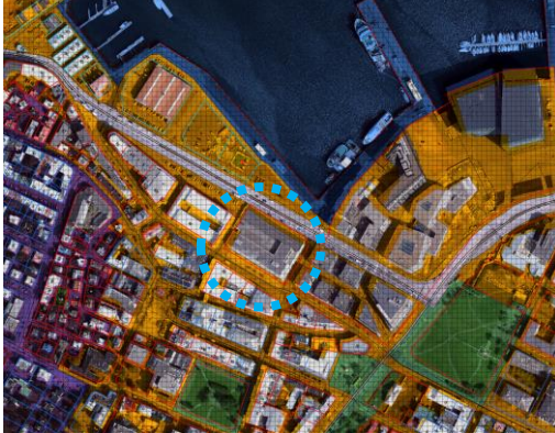
Aðalskipulag Reykjavíkur 2040

Á embættisafgreiðslufundi skipulagsfulltrúa 7. mars 2024 var lögð fram fyrirspurn Framkvæmdasýslu-Ríkiseigna, dags. 21. febrúar 2024, ásamt bréfi, dags. 21. febrúar 2024, um samtal og samráð við Reykjavíkurborg um skipulag lóðar nr. 19 við Tryggvagötu og tengingu nýrrar byggingar Listaháskóla Íslands, LHÍ, í og við Tollhúsið við nærliggjandi umhverfi.