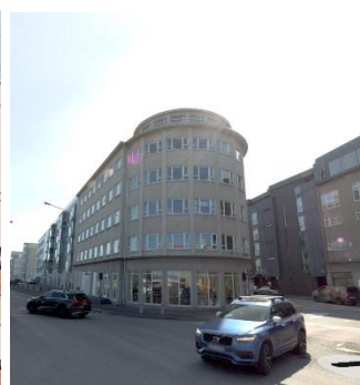
Götumynd, tekin af Já.is.