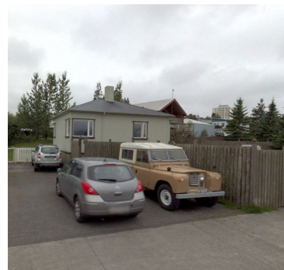
Kleppsvegur 102, skjáskot af ja.is.