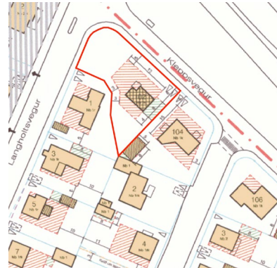
Hluti deiliskipulags í gildi, 2005.