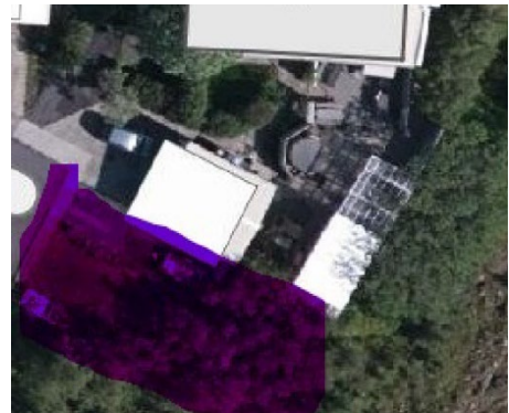
Loftmynd með afmörkuðu svæði