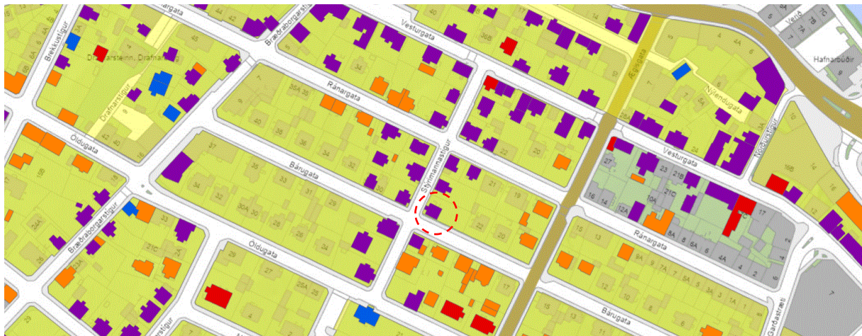
Hús- og hverfisvernd á svæðinu.

Svipmóti húsa, á tilgreindum verndarsvæðum sem verða nánar afmörkuð í deili- og/eða hverfisskipulagi, varðandi ytra byrði, veggáferð, gluggagerðir og þak verði sem minnst raskað og endurbygging miðist sem mest við upphaflega gerð hússins – sama gildi t.a.m. um afmörkun lóða, svo sem garðveggi og girðingar.