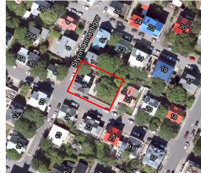
Loftmynd, 18. 09. 2023