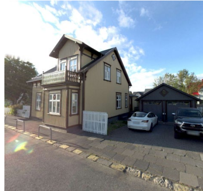
Skjáskot af vefsíja ja.is, 2022.