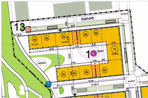
Gildandi deiliskipulag: Reitur 1

Lögð fram uppfærð fyrirspurn Dverghamra ehf., dags. 14. september 2023, ásamt greinargerð hönnuðar, dags. 8. ágúst 2023, um uppbyggingu á lóð nr. 2 við Stálhöfða, samkvæmt aðalteikningum ARCHUS arkitekta, ódags. Einnig er lögð fram yfirlitsmynd Landslags, dags. í september 2023.