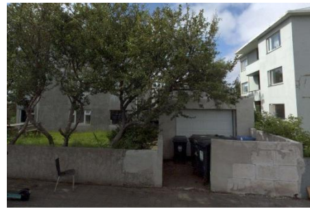
Götumynd tekin af já.is, séð frá Auðarstræti