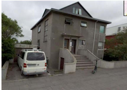
Götumynd tekin af já.is, séð frá Snorrabraut