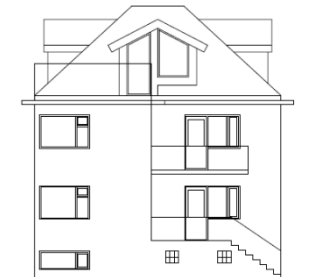
útlit suður ef ekki er farið yfir svalir á 2 hæð