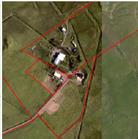
Loftmynd, dags. 17.7.2023