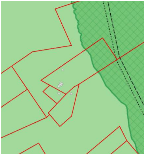
Hluti aðalskipulags Reykjavíkur 2040

Lagt fram erindi frá afgreiðslufundi byggingarfulltrúa frá 2. júlí 2024 þar sem sótt er um leyfi fyrir áður gerðum breytingum og einnig er sótt um leyfi til að byggja svalir, auk þess er verið að sækja um að sameina mhl. 01, 02, 03, 04, 06, 08 og 09 í einn mhl. sem allir verða þá í mhl. 01. Mhl. 07 verður að mhl. 11 sem þjónustubygging og mhl. 10 helst sem mhl. 10.