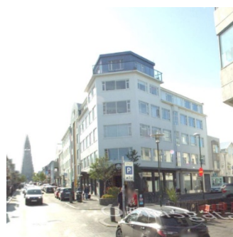
Götumynd tekin af já.is