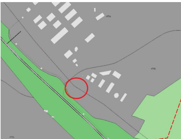
Landnotkun skv. aðalskipulagi Reykjavíkur 2040.

Lögð fram fyrirspurn Jóns Hrafns Hlökkverssonar, dags. 6. desember 2023, um breytingu á notkun efri hæðar hússins á lóð nr. 2 við Silfursléttu úr skrifstofu í gistirými. Einnig eru lagðir fram uppdættir Mansard teiknistofu. dags. 26. október 2021 og 15. nóvember 2021.